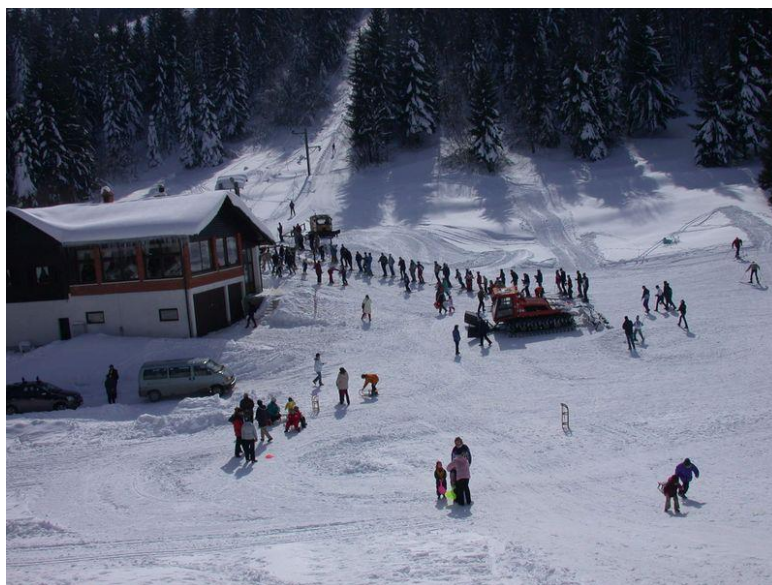
Slika 21. Skijalište “Rudnik” u Tršću