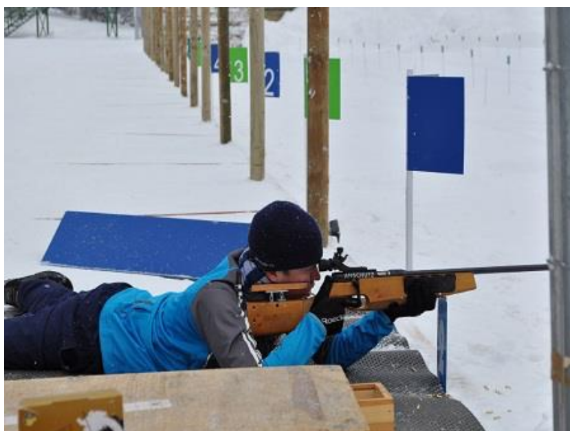
Slika 15. Prvenstvo šumara Europe na Vrbovskoj poljani

U ovom nordijskom centru 2013. godine održana je najveća sportska zimska manifestacija koja je ikada održana u Hrvatskoj. Održano je Prvenstvo šumara Europe u nordijsko-pucačkim disciplinama koje je brojalo čak 1500 učesnika. Organizatori su bili Općina Mrkopalj i Hrvatske šume.