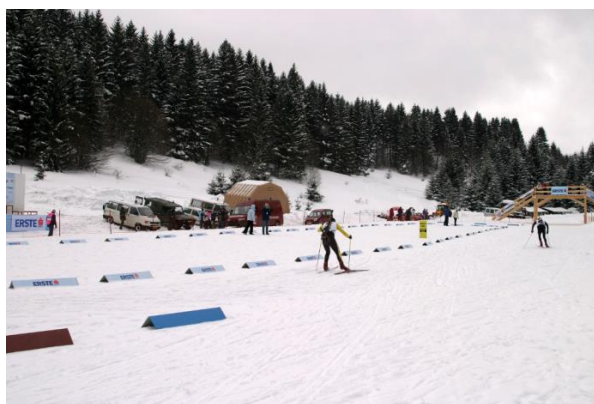
Slika 13. Biatlon centar Zagemajna