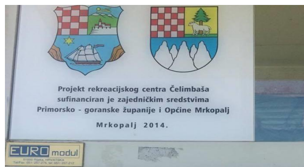
Slika 8. Natpis načina financiranja skijališta

U razgovoru s nadležnima, skijalište je prethodnu zimu bilo u funkciji pet dana što je jako tužno za jedan skijaški centar i cijeli Gorski kotar. Riječ je o “slabim” zimama, pretopla klima, južni vjetar i kao posljedica svega dolazi do brzog topljenja snijega. S obzirom na skoro nikakva ili mala ulaganja zbog lošeg financijskog stanja, skijalište iz godine u godinu sve više propada, nemogućnost kupnje snježnih topova i nezainteresiranost same države oko ovakvih investicija ne dovodi do pozitivnih rezultata.