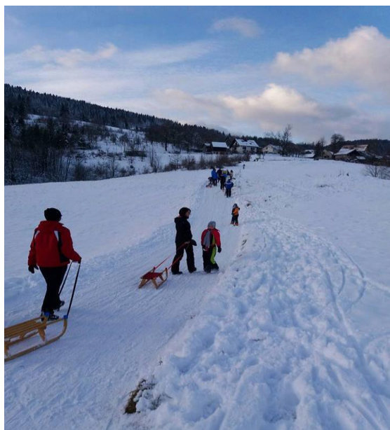
Slika 23. Staza u Vujnovićima