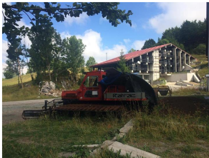
Slika 12. Hotel "Jastreb" i stroj za uređivanje staze, slikano u ljeto 2017. godine

sanjkanje, dodatno proširenje izbora sportova na snijegu, različite aktivnosti za djecu, a time bi gosti imali i gdje boraviti.