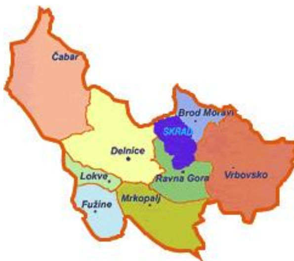
Slika 1. Zemljopisna karta Gorskoga kotara