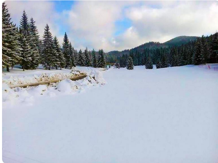
Slika 14. Vrbovska poljana