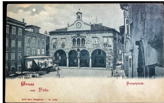
Slika 7. Pulski Vijećnica, Forum 8

Pula kao najveća baza Austro-Ugarske ratne mornarice ( slika 8 ) godinama se razvijala kao središte morskih i prometnih puteva, tada u vojne svrhe, a danas, zahvaljujući tim komunikacijama razvija se u vodeću turističku regiju u Republici Hrvatskoj. Podzemni tuneli kojima je grad isprepleten bili su u funkciji strateškog kretanja vojske. Grad je, po uzoru na Rim, izgrađen na 7 brežuljaka.