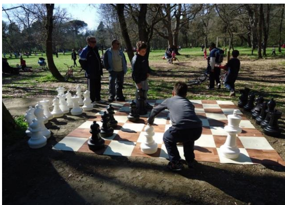
Slika 9. Šah u Šijanskoj šumi

Program traje tri do četiri vikenda uz mnoge sportske i sportsko-rekreacijske, te zdravstvene aktivnosti ( slike 9, 10 ) 11 .