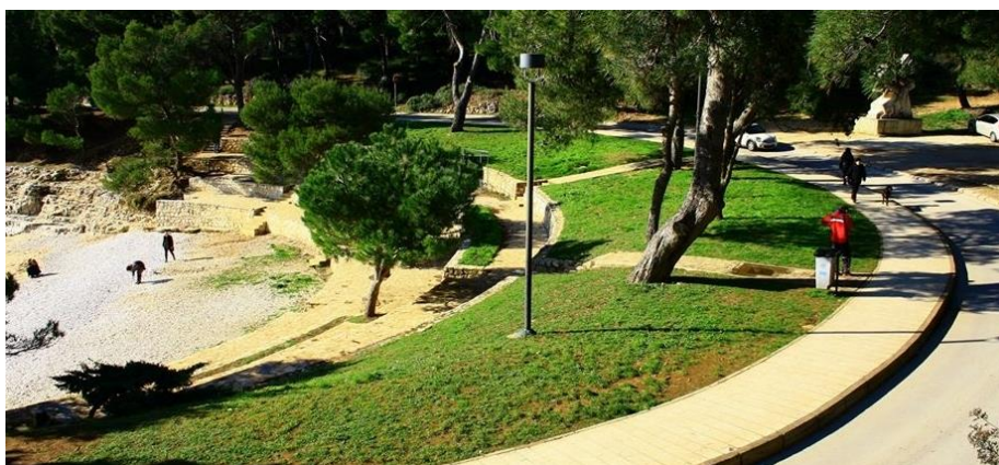
Slika 11.. Šetnica Lungomare 12

Valja istaknuti sportsko-rekreacijski program „Kotačićima uz more“ koji se održava zadnji tjedan u sklopu „Jeseni uz Lungomare“. Velika je prednost ovog programa atraktivna lokacija koja nema arhitektonskih barijera, što ju čini pogodnom za sportsko-rekreacijske aktivnosti osoba s invaliditetom. Za sigurnost ovoga sportsko-rekreativnog programa zadužena je biciklistička ophodnja Policijske postaje Pula.