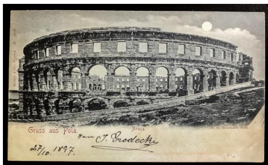
Slika 6. Pulski Amfiteatar 1897. godine 7

Poznati britanski dnevni list „The Guardian“ na svome je portalu istaknuo pulsku Arenu kao primjer jednog od najbolje očuvanih rimskih amfiteatara koji do danas ima posve sačuvane sve tri kamene razine. Stoga ne čudi podatak da je Pulu je Arenu u 2015. godini (kraj studenog) posjetilo 394.235 posjetitelja. (Golja i sur., 2015).