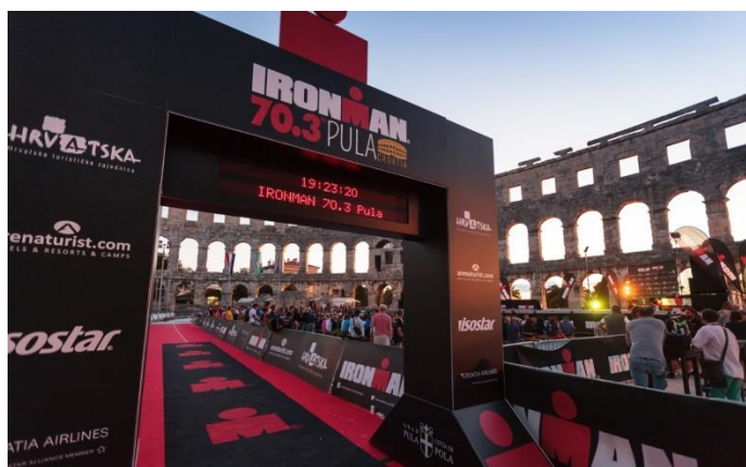
Slika 17. Cilj Ironman utke u Pulskoj Areni 18

Osim toga, dan ranije organizirana je dječja utrka „Ironkids“ kao popratni event, kojom se promovirala glavna utrka i njome su se otvorile mogućnosti daljnje tradicijske organizacije dječje utrke (Ironman 70.3 Pula, 2016).