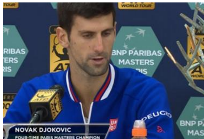
Slika 2. Novak Đoković, info-ks.net (2016.)

„On je tvrdio da nikada nije pristao na ponude za namještanje mečeva, ali i da mu je u više navrata nuđen novac za poraze u glavnom ždrijebu na velikim turnirima ATP serije. Kada je prošle godine prije Australian Opena upravo BBC zajedno s BuzzFeedom objavio informacije da je 16 tenisača iz top 50 ATP liste pod istragom zbog namještanja, tadašnji je teniski broj jedan Novak Đoković potvrdio da mu je preko posrednika 2006. nuđeno 200 000 dolara da pusti meč prvog kola u Sankt Petersburgu.“ ( telesport.telegram.hr, 2017 ).