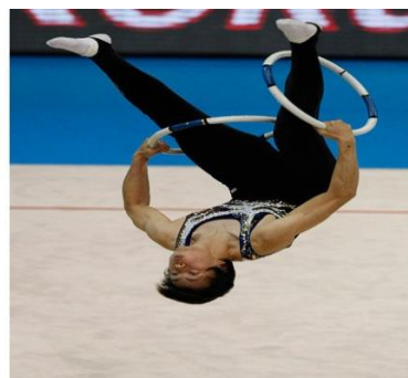
Slika 3: 2 mala koluta