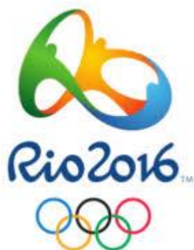
Slika 1. Prikaz loga Olimpijskih igara u Riju

Cilj istraživanje je utvrditi razlike između pokazatelja situacijske efikasnosti muških rukometnih ekipa u grupama A i B na Olimpijskom turniru u Riju 2016.godine.