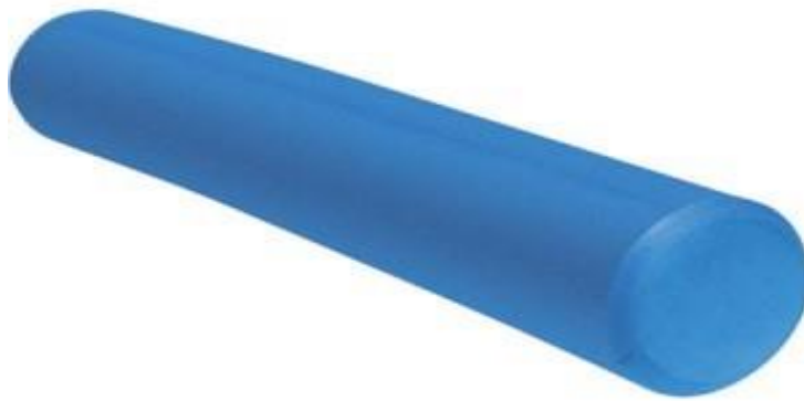
Slika 5. Obični valjak.

Slika br. 5 prikazuje obični pjenasti valjak koji je izrađen od posebne spužve i najmekši je valjak od svih pjenastih valjaka. Izaziva najslabiju kompresiju na mišiće. Nedostatak mu je što s vremenom gubi oblik i čvrstoću.