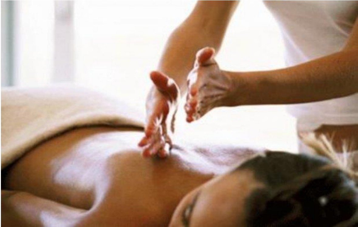
Slika 3. Zahvat sjeckanja.