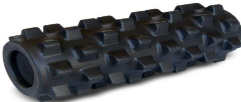
Slika 6. Rumble valjak.

Rumble pjenasti valjak ima čvrste i izbočene kvрге koje služe za duboku masažu što možemo vidjeti na slici broj 6.