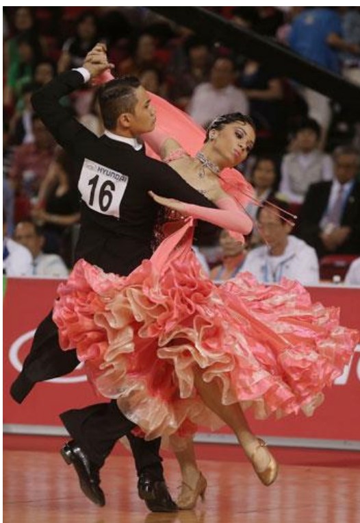
Slika 2. Tango