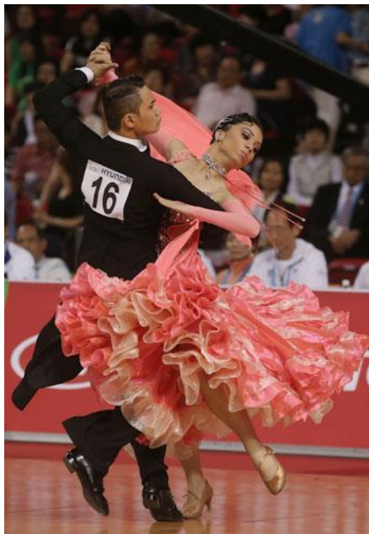
Slika 2. Tango