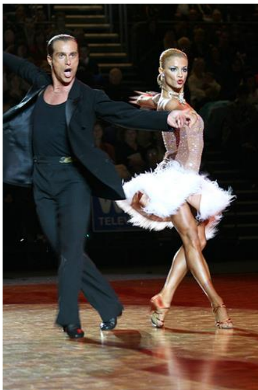
Slika 7. Cha-cha-cha