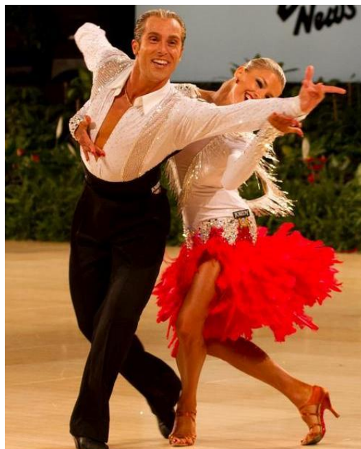
Slika 6. Samba