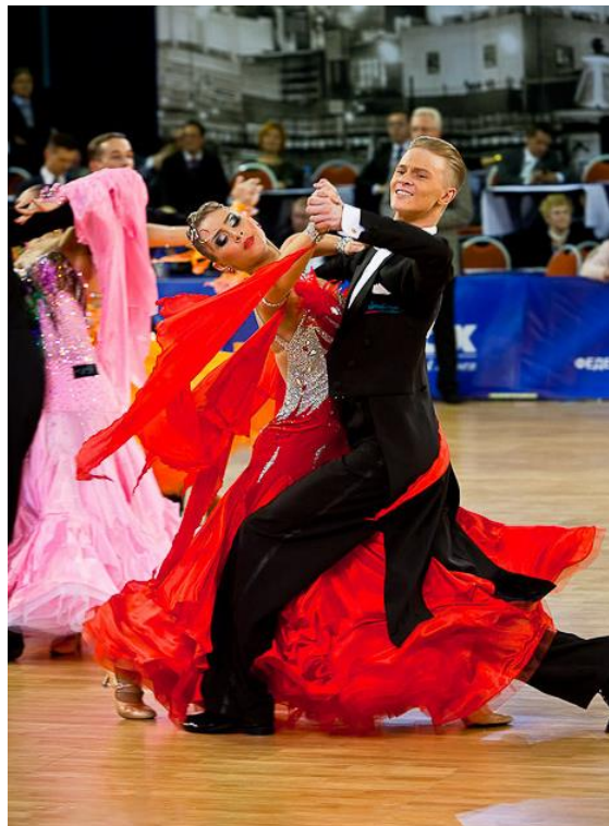
Slika 1. Engleski valcer