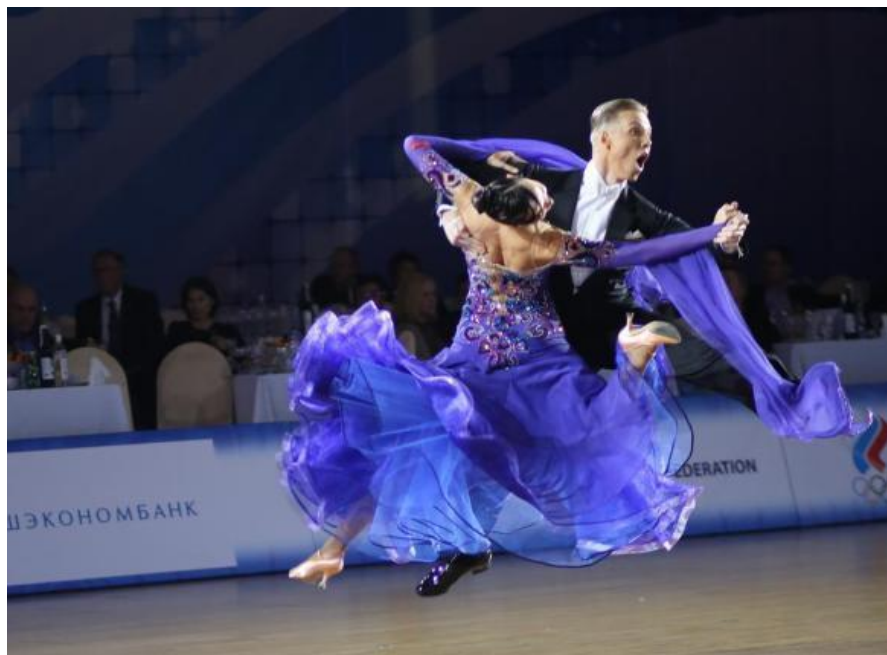
Slika 5. Quickstep