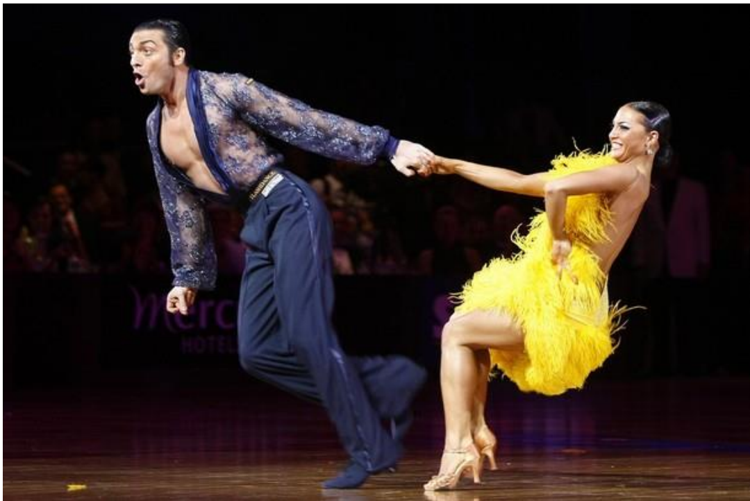
Slika 10. Jive