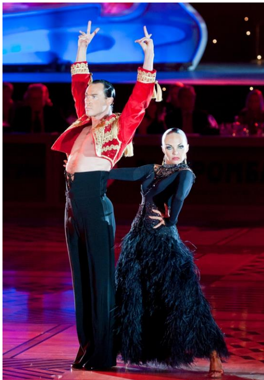
Slika 9. Paso doble