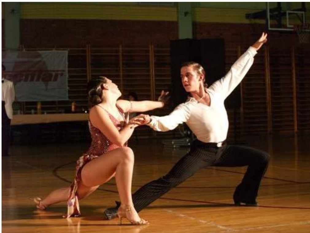
Slika 8. Rumba

Unatoč navedenom sporijem tempu s obzirom na druge plesove, Rumba ne dozvoljava nepravilnu izvedbu tehnike, već suprotno. Precizna tehnika u izvođenju dolazi do izražaja, a posebno kod plesnih parova naprednijih kvalitativnih razreda koji zahtijevaju koreografije ispunjene sinkopama 3 . S obzirom na sinkopirane ritmove pojavljuju se promjene kretanja, usuglašene s igrom u paru, koje zahtijevaju izuzetnu sposobnost dinamičke ravnoteže. Pleše se kao treći ples na plesnom natjecanju te nakon dva karakterno veselija plesa, plesači izvedbom Rumbe moraju pokazati erotsku igru te kroz plesne figure prikazati umjetnost ženskog zavoda. (Ljubojević i Bijelić, 2014).