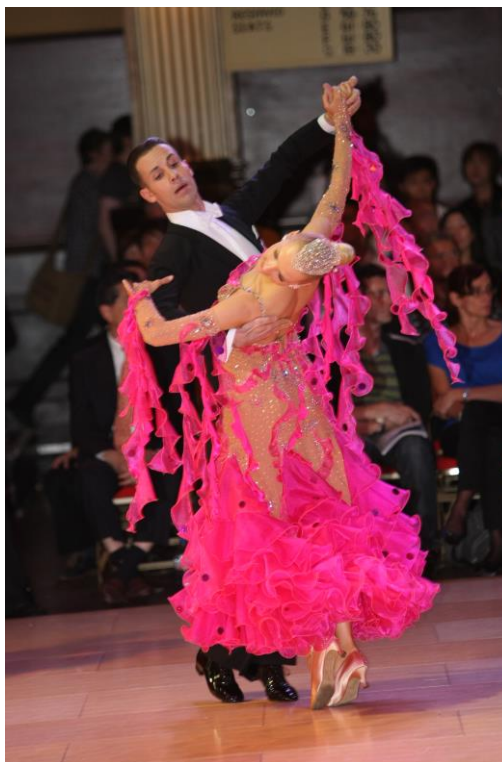
Slika 4. Slowfox