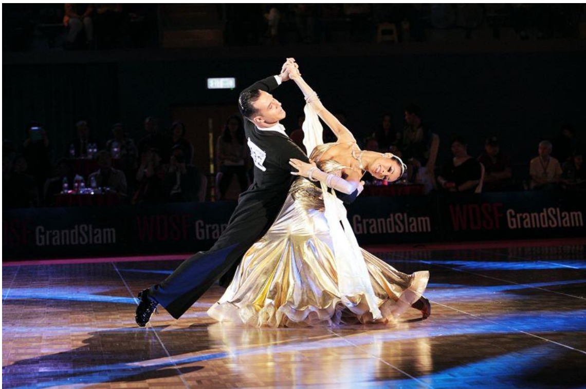
Slika 3. Bečki valcer