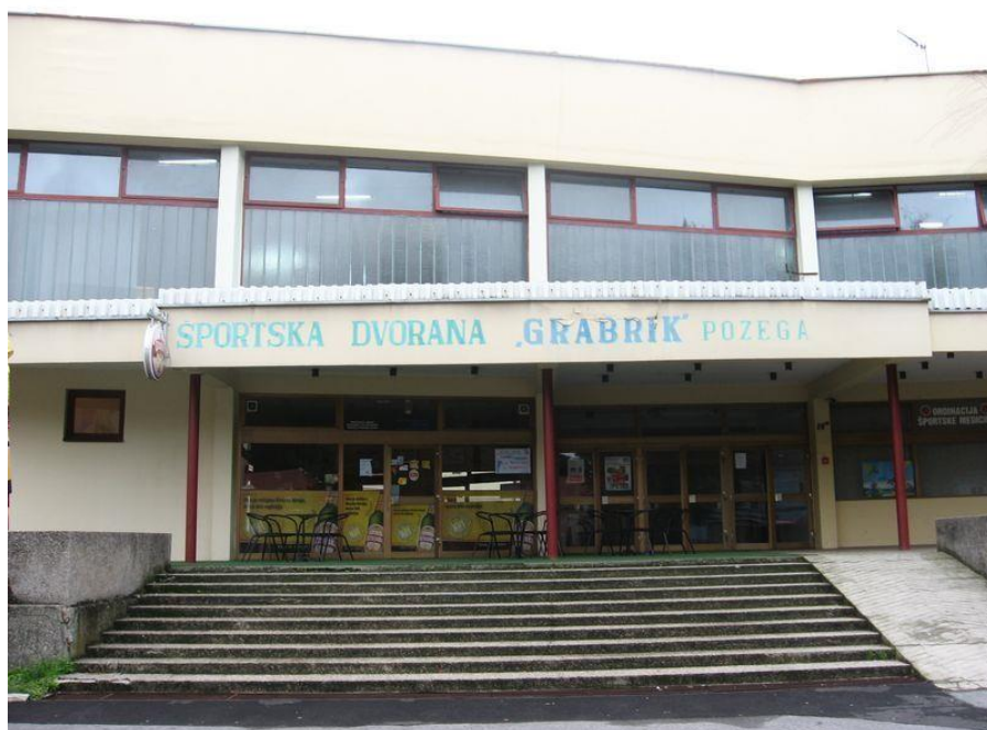
Slika 3. Sportska dvorana Grabrik