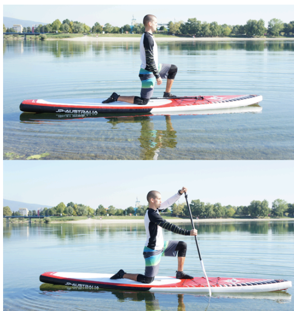
Slika 9. Modificirana pozicija jednokleka i pravilna tehnika veslanja u III. Fazi

POGREŠKE: gubljenje ravnoteže, trup nije potpuno uspravan pri iniciranju niti ide u blagi pretklon pri zaveslaju, nakon par zaveslaja pad "na sve četiri", nedovoljna aktivacija trupa, METODIČKE VJEŽBE: izmjenjivanje dubokog i snažnog zaveslaja te više kratkih i brzih zaveslaja kako bi polaznik uočio razlike u kretanju daske, držanje pozicije kleka s rukama i veslom u uzručenju – predručenju / pretklonu-zaklonu, snimanje tehnike i ukazivanje na pogreške