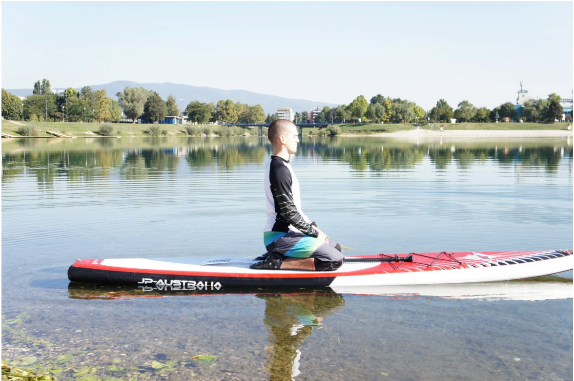
Slika 7. Početna pozicija druge faze