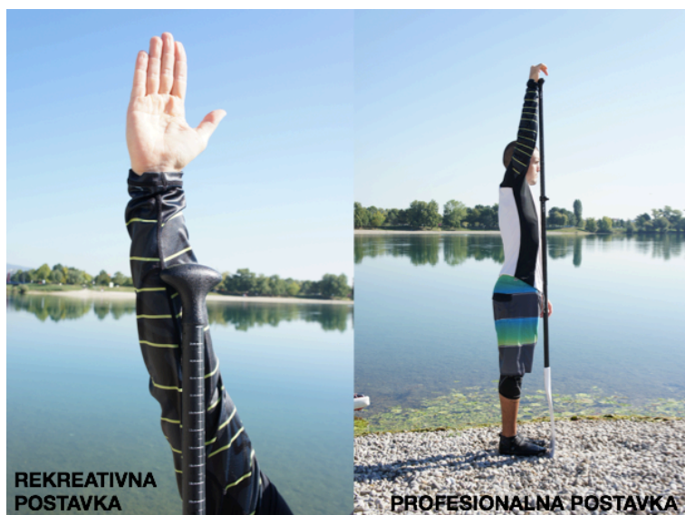
Slika 5. Rekreativna i profesionalna postavka vesla

Visina vesla određuje se na nekoliko načina te varira s obzirom na željenu primjenu. Često korišten način (Wright, M., 2013) je sljedeći: u stojećem stavu ruku kojom veslate (hvatate držak vesla) stavite u uzručenje s blagim kutom od 170^\circ u zglobu lakta te prislonite veslo uz cijelu ruku i tijelo. Lopatica vesla dodiruje pod. Visina vesla se prilagođava na pola duljine podlaktice – rekreativna postavka (dugotrajno veslanje), ili točno na članku zgloba šake – profesionalna postavka (veća brzina i snaga veslanja) – Slika 5.