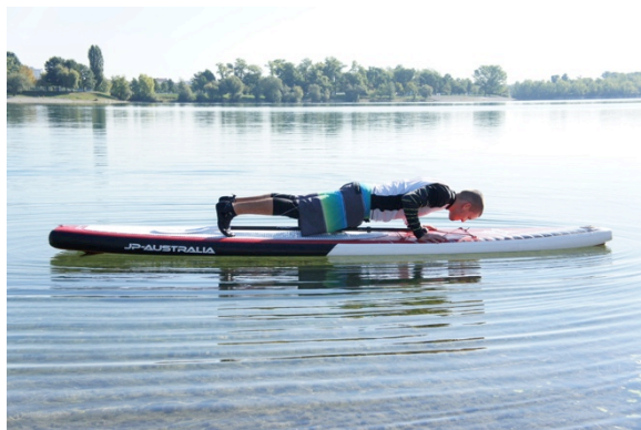
Slika 13. Sklekovi na dasci