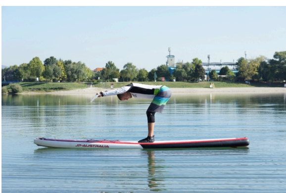
Slika 16. Duboki pretklon veslo u uzručenju