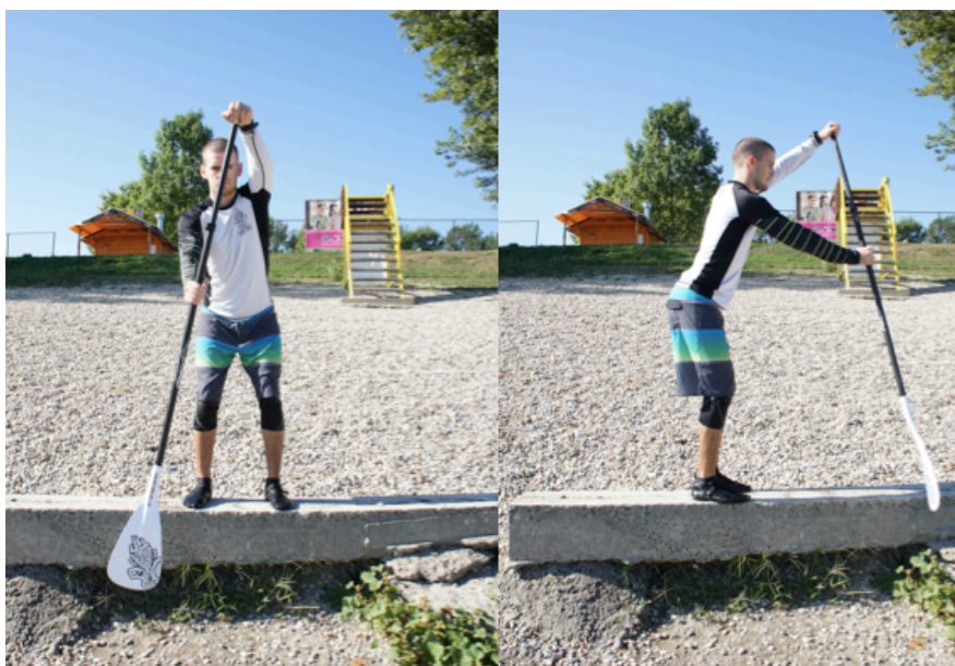
Slika 6. Držanje vesla i pravilna tehnika veslanja – I. faza

POGREŠKE: loše držanje vesla, kriva strana pozicije vesla u odnosu na ruke, nema pretklona, korištenje prvo manjih pa onda većih mišića pri veslanju METODIČKE VJEŽBE: analitički način učenja (po fazama), snimanje tehnike i ukazivanje na pogreške, davanje otpora veslu elastičnom trakom radi ukazivanja na pogreške