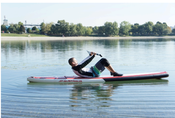
Slika 14. Podizanje trupa s veslom u predručenju