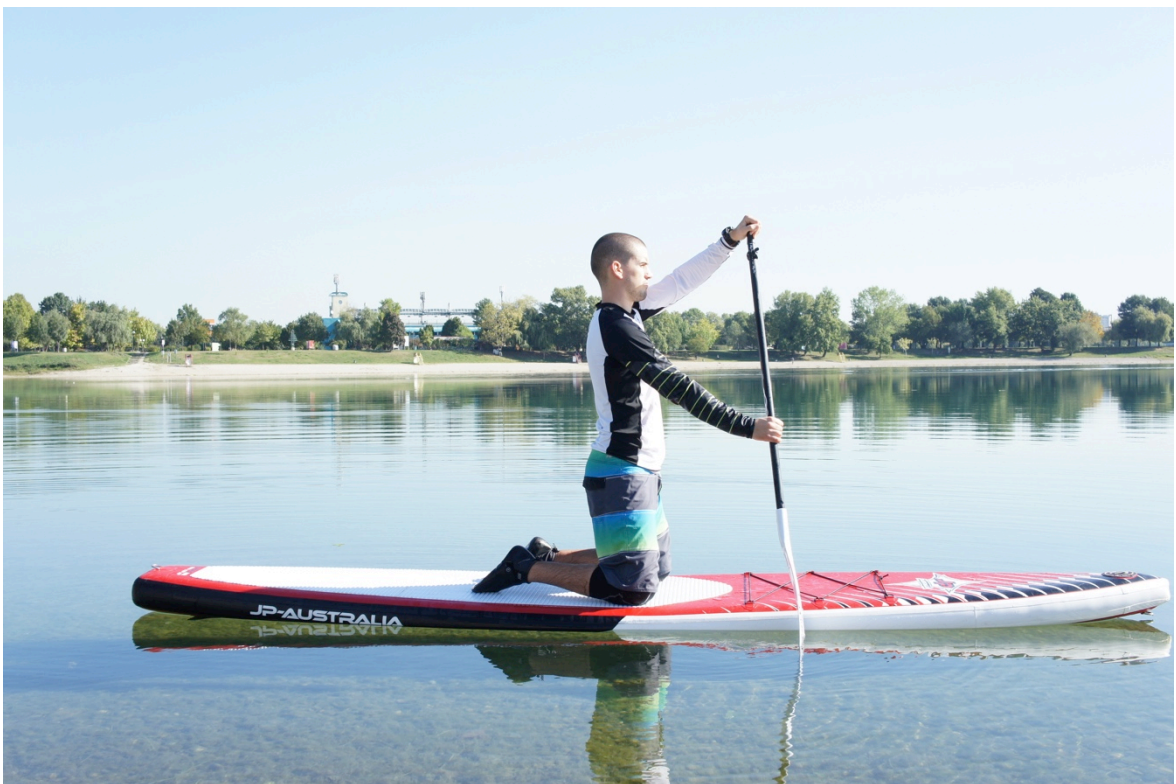
Slika 8. Konačna pravilna pozicija II. faze – Klečanje na obje noge na dasci i veslanje