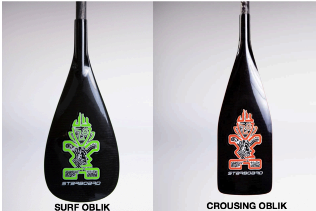
Slika 4. Tipovi vesla, Starboard, 2015, skinuto s interneta:

Vesla se, kao i daske, najočitije razlikuje po materijalima koja su korištena za njihovu izradu. Postoje aluminijska vesla koja mogu biti u jeftinijim varijantama i 1.5kg težine, vesla od stakloplastike koja su težinom ispod kilograma te na kraju natjecateljska vesla od karbona koja mogu težiti samo 500g. Oblik i veličina same lopatice najviše diktira primjenu vesla – pa tako najlakše prepoznamo surf i crousing oblik – Slika 4.