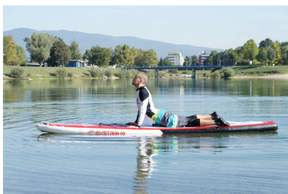
Slika 17. Uvnuće leđa u ležanju na trbuhu