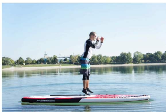
Slika 15. Skok u vis iz čučnja