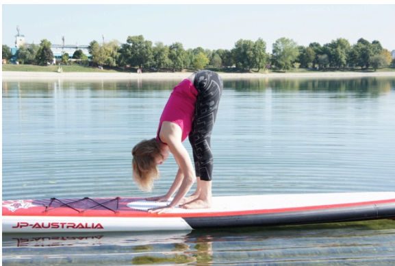
Slika 19.– Pretklon u stajanju