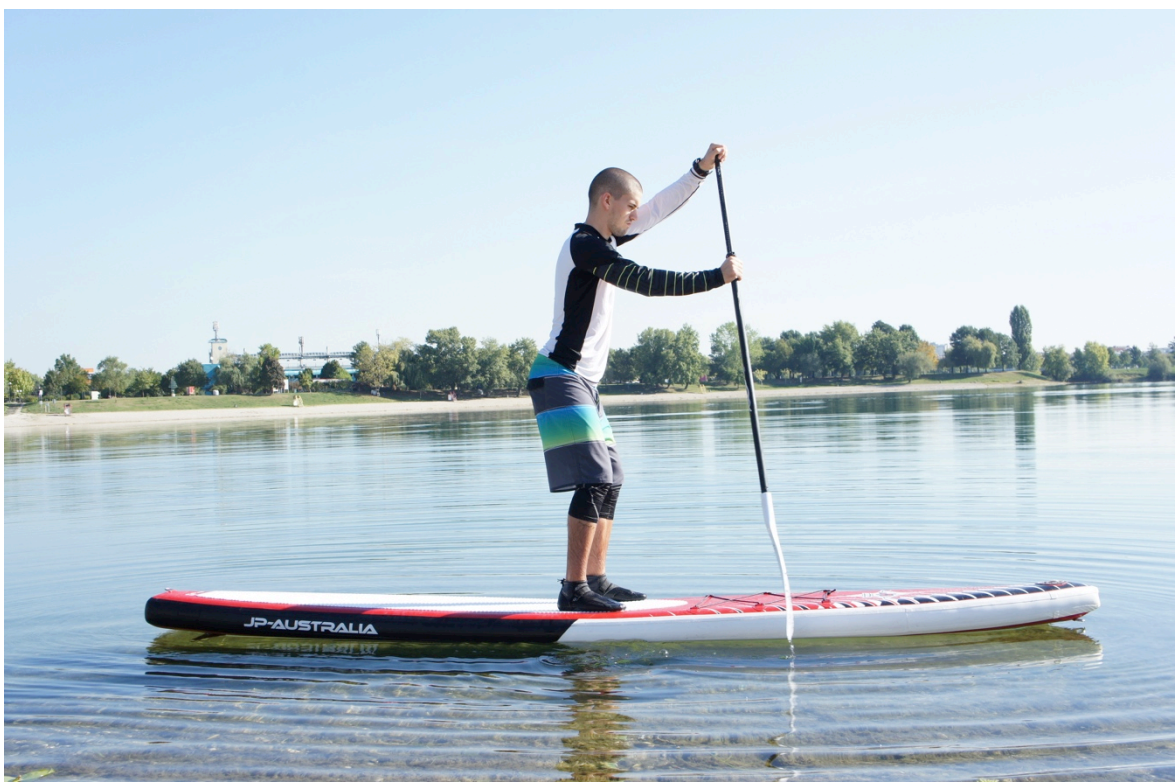
Slika 11. Veslanje u uspravnom položaju – IV. Faza