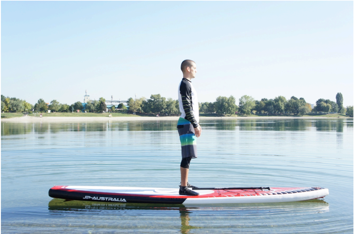
Slika 10. Pravilan uspravni položaj na dasci