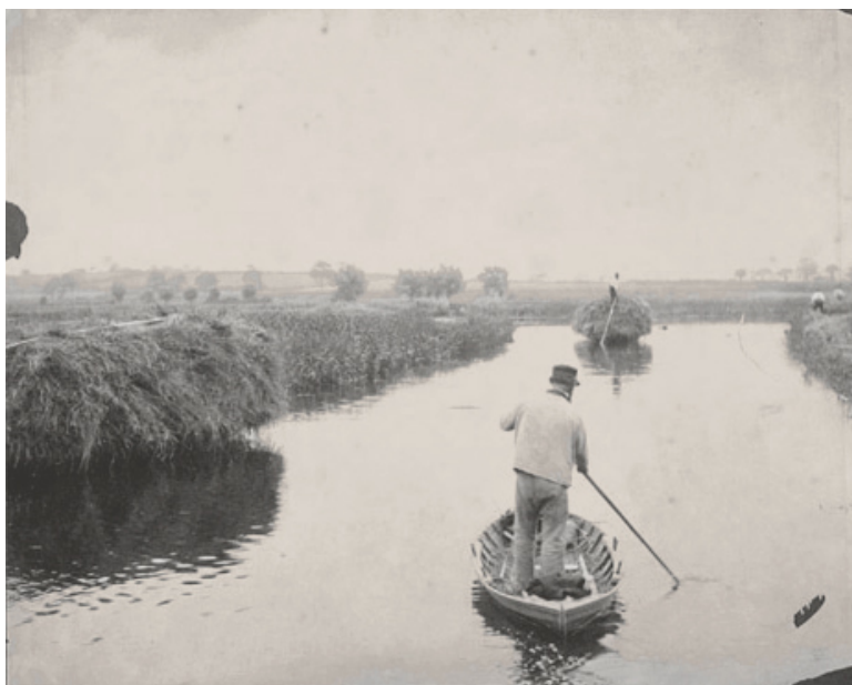
Slika 1. Quanting the Marsh Hay: P.H.Emerson, 1886 – skinuto s interneta:

Prema povijesnim izvorima (Casey, R. 2011.) na prvim daskama veslali su Peruvijanski ribari nazivajući ih caballitos de totora . Koristili su duge bambusove štapove kako bi se vratili na obalu nakon cijelodnevnog lovljenja ribe. Na Havajima su domorodci davne 1778. godine koristili štapove drveta koa kako bi odveslali prema pučini te nakon okreta, lovljenja valova za surfanje. Spominju se mnoge slične upotrebe daske i štapa kroz Afriku i Južnu Ameriku a nama bliži primjer dolazi iz Engleske gdje je P.H. Emerson 1886. godine prvi zabilježio upotrebu štapa nalik veslu za veslanje u stajaćem položaju – Slika 1.