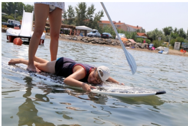
Slika 18. – Primjena programa veslanja na dasci u radu s djecom sa posebnim potrebama

Veslanje na dasci može se provoditi uz pasivno sudjelovanje djece sa posebnim potrebama i osobama s invaliditetom ili aktivnim sudjelovanjem prema njihovim individualnim motoričkim mogućnostima. Pasivno sudjelovanje značilo bi sjedenje, ležanje ili stajanje na dasci (ili prikladni položaj) dok druga osoba vesla. Kao drugu osobu uvijek bi preporučljivo bilo da je to roditelj ili netko blizak djetetu kako bi se ono osjećalo ugodno i zaštićeno. Ako dijete ima motoričke i kognitivne mogućnosti za aktivno provođenje aktivnosti veslanja treba ga poticati na akciju te provođenje takve aktivnosti. Veslanje na dasci, po svim pokazateljima, moglo bi ponuditi alternativu terapijskom jahanju i sličnim programima te unjeti nove mogućnosti u rehabilitaciju djece sa posebnim potrebama.