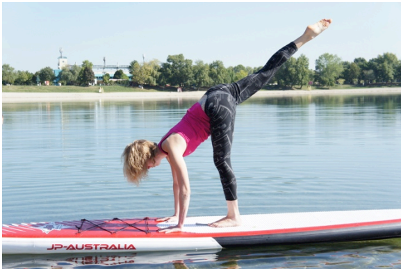
Slika 18.– Ratnik III