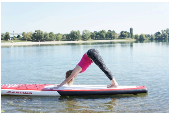
Slika 20.– Pas prema gore