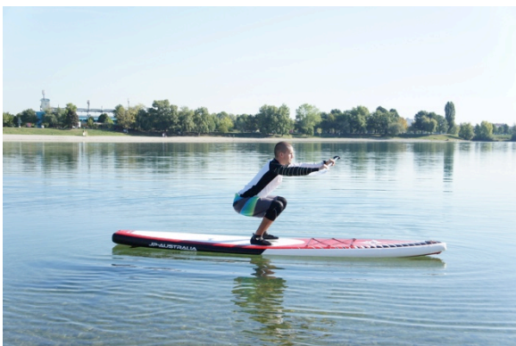
Slika 12. Čučnjevi na dasci s veslom u predručenju