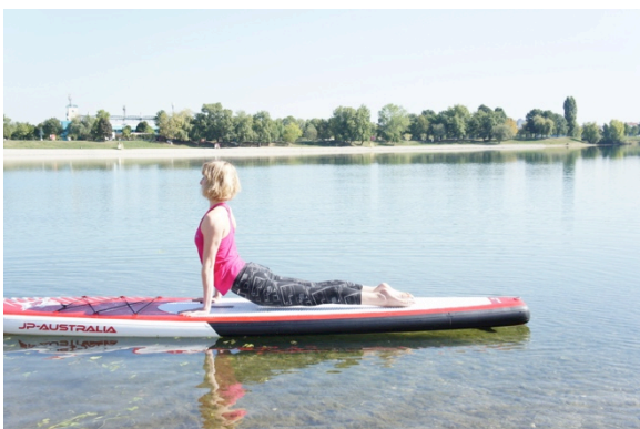
Slika 21.– Položaj planine