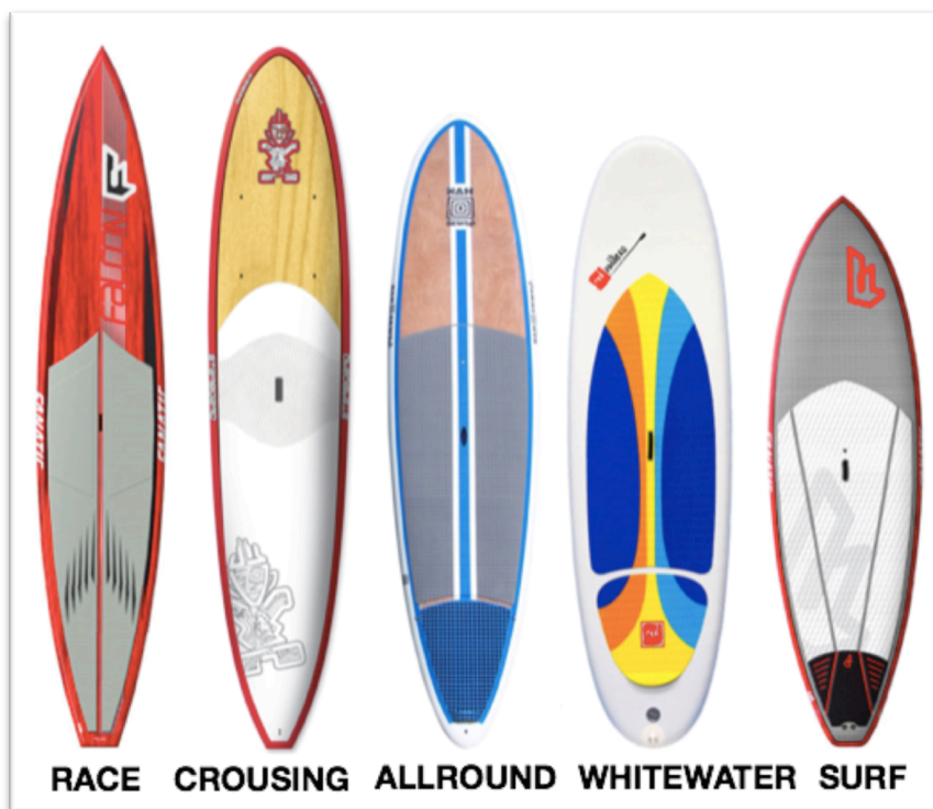
Slika 3. Tipovi dasaka, Supboardermag 2015, skinuto s interneta:

(duže=brže) dok širina određuje stabilnost (šire=stabilnije). Debljina daske varira 10-16cm te ima utjecaja na "litražu" a samim time i nosivost. Nosivost se definira maksimalnom težinom koju daska može podnijeti prije gubljenja svojih specifikacija i plovnosti, a varira između 60 kilograma pa sve do 600tinjak kilograma daska za 8 korisnika. Oblik same daske može se dijeliti u izrazito mnogo kategorija i podkategorija te je zbog jednostavnosti i razumijevanja uputno izdvojiti pet najvažnijih (Grupa autora, 2015): surf , whitewater , allround , crousing i race – Slika 3.