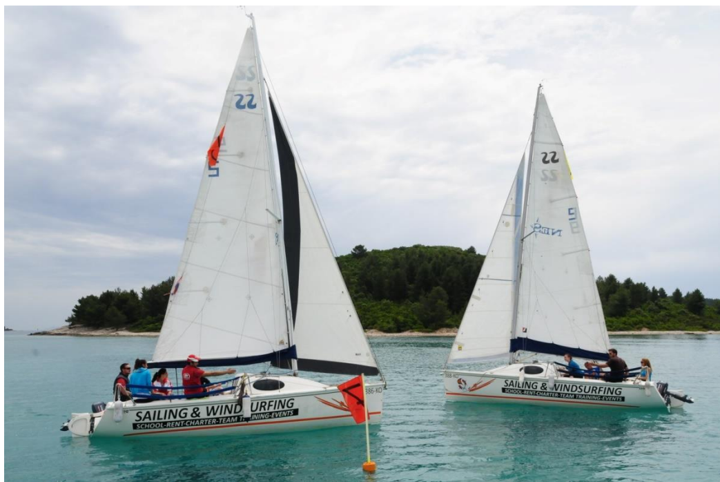
Slike 1. Jedrenje među plutačama