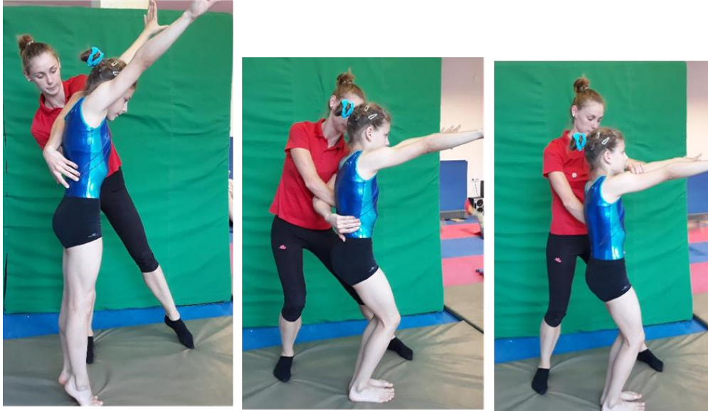
Slika 11. Asistencija premeta naprijed salta naprijed zgrčenog