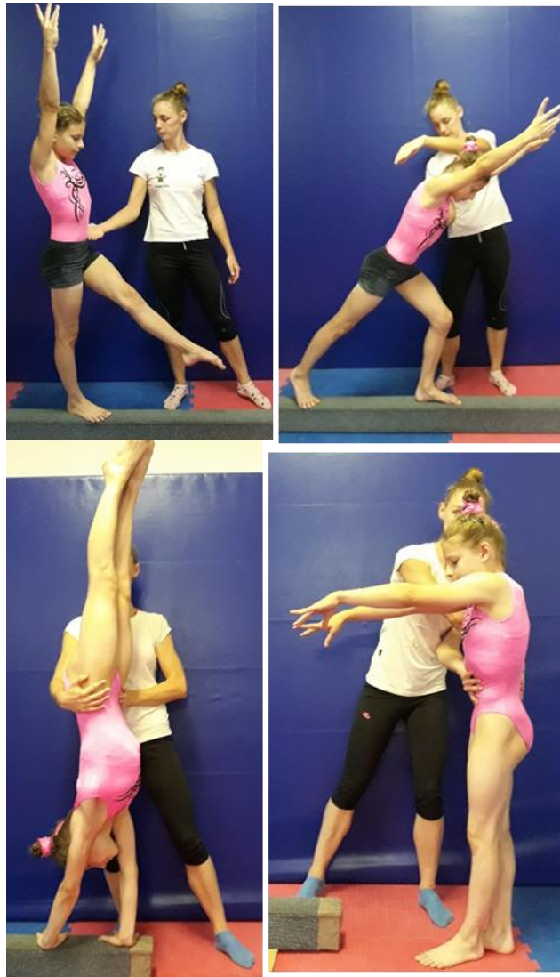
Slika 9. Asistencija rondat saskoka