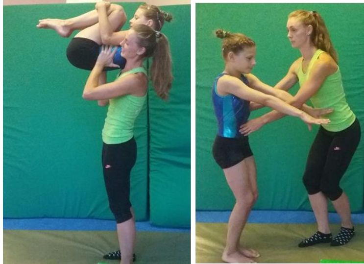
Slika 13. Asistencija metodičkog učenja salta naprijed zgrčenog s okretom za 180°