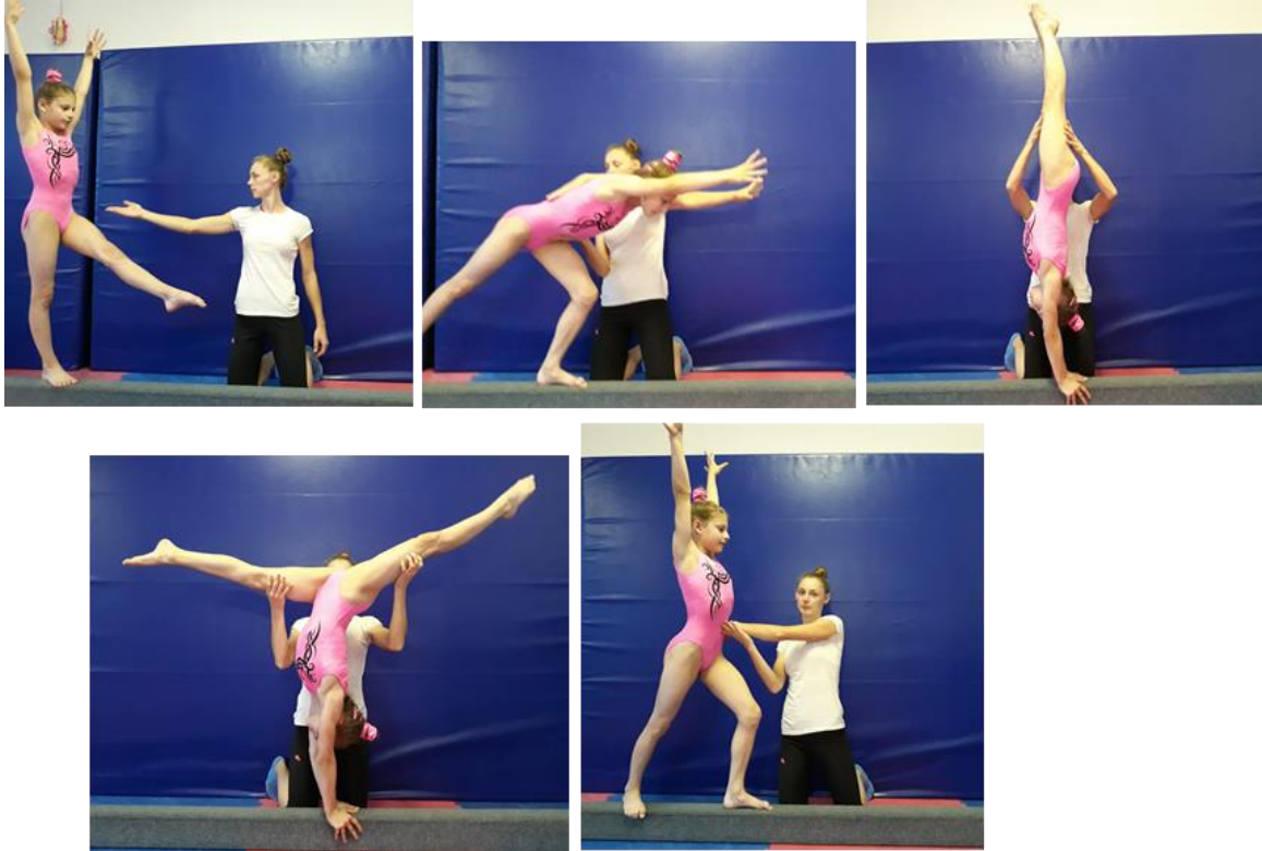
Slika 6. Asistencija stoja na rukama

Trener se nalazi bočno u odnosu na vježbačicu sa strane odrazne noge u klečećem položaju ako se radi na podnoj gredi, te hvatom za natkoljenicu usmjerava vježbačicu u pravilan okomiti položaj. U stoji na rukama drži vježbačicu za natkoljenice. Nakon doskoka premješta ruke na trup kako bi vježbačica zauzela što stabilniji položaj na gredi.