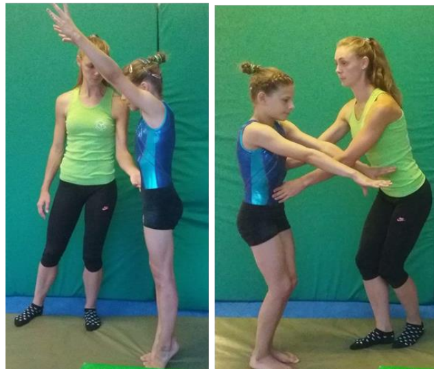
Slika 14. Asistencija zgrčenog salta naprijed s okretom za 180°