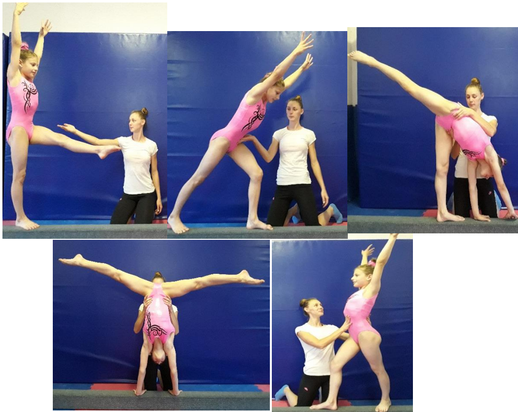
Slika 5. Asistencija premeta strance

Trener se nalazi čeonu u odnosu na gredu te bočno u odnosu na vježbačicu sa strane odrazne noge vježbačice u klečećem položaju ako se radi na podnoj gredi, te bližom rukom hvata za bliži kuk i usmjerava vježbačicu da tijelom prelazi preko okomice, a nakon dolaska tijelom u fazu stoja na rukama daljom rukom hvata drugi kuk te na taj način pomaže vježbačici sigurno postaviti stopala na gredu. Na kraju premješta ruke na prednju i stražnju stranu trupa kako bi osigurao doskok.