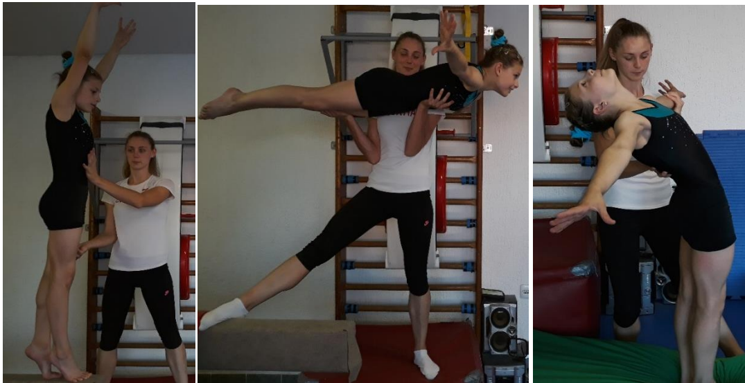
Slika 26. Asistencija saskoka salta naprijed pruženog