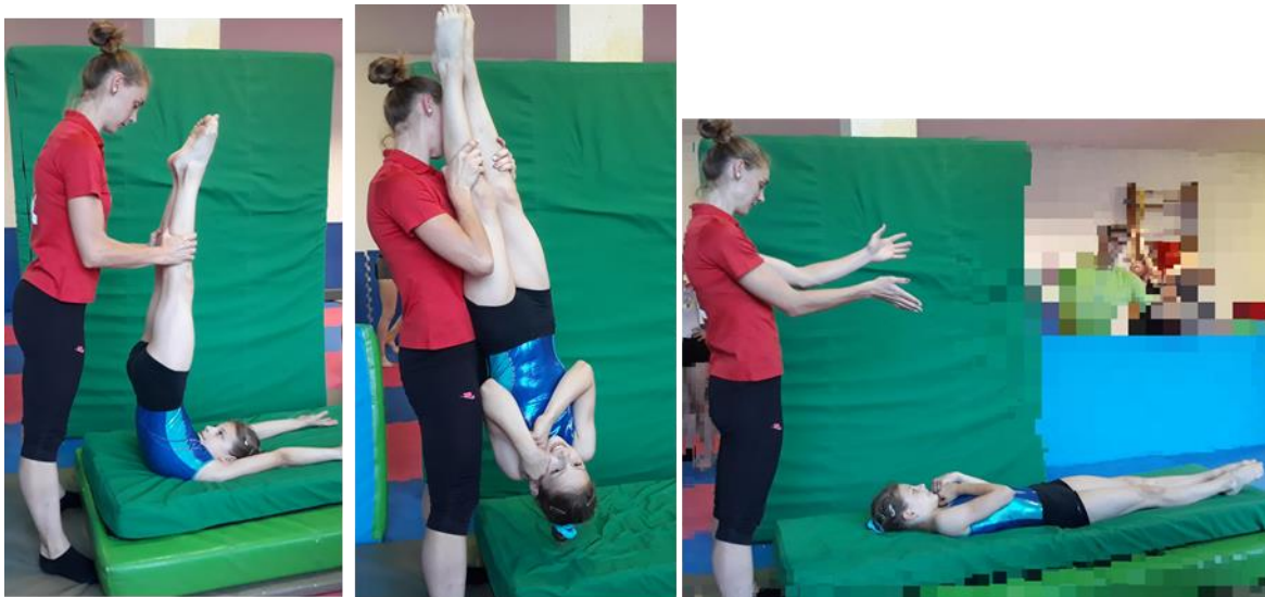
Slika 16. Asistencija metodičkog postupka učenja salta natrag pruženog s okretom za 360°

Kod učenja ovog elementa trener ima važnu ulogu pri usvajanju osnovne kretne strukture. Trener uči vježbačicu pruženi salto s okretom, tj. tzv. „šraubicu“ na način da imitira okret oko uzdužne osi za 360° noseći ju kroz ruke. Nakon što je usvojena osnovna kretna struktura gimnastičarka sama izvodi salto s okretom. Trener se pri izvedbi ove akrobatske veze nalazi bočno u odnosu na vježbačicu u stojećem položaju, na mjestu doskoka iz premeta natrag te pomaže pri zamahu nogama u salto natrag pruženi. Nakon doskoka iz premeta natrag trener mora niže spustiti težište tijela te dalju ruku postavlja na donji dio leđa vježbačice, a drugu na stražnju stranu natkoljenica kako bi pomogao pri podizanju pruženog tijela i time olakšao rotaciju tijela. Nakon što je rotacija završila trener se pomakne na mjestu doskoka kako bi osigurao što sigurniji doskok hvatom za trup.