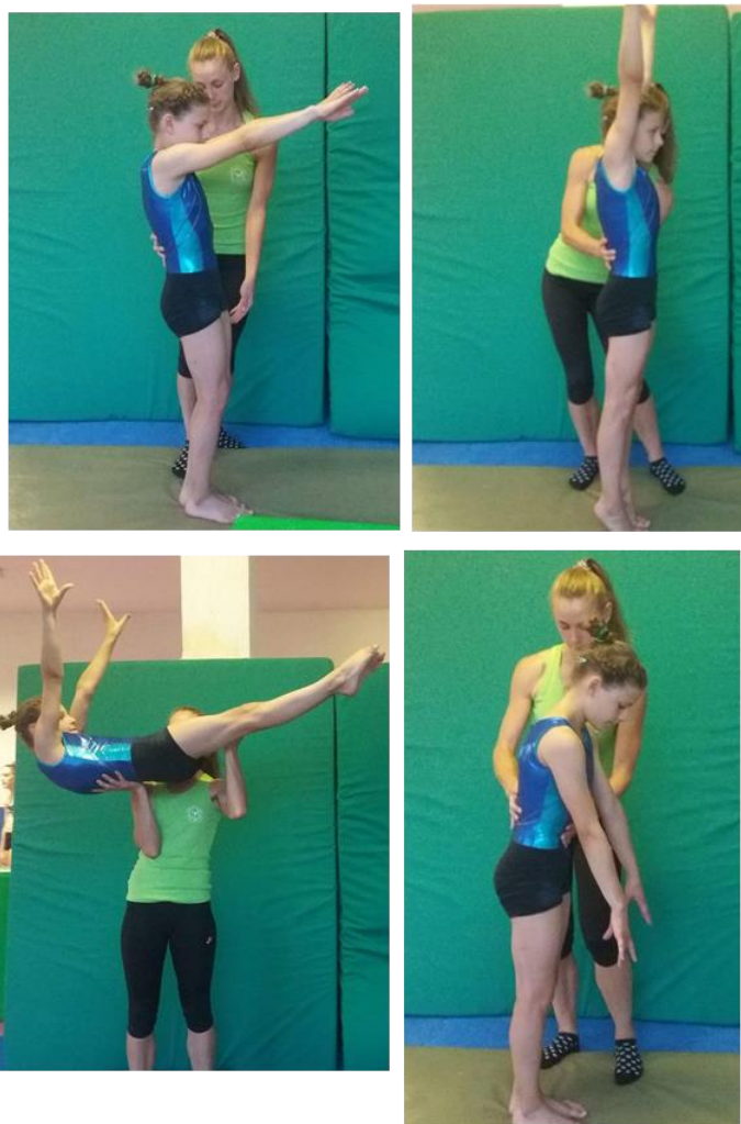
Slika 15. Asistencija rondat premeta natraga salta natrag pruženog

Rondat premet natrag salto natrag pruženi osnovna je akrobatska veza u sportskoj gimnastici. Izvodi se nakon što je svaki element naučen samostalno. Trener se nalazi bočno u odnosu na vježbačicu u stojećem položaju. Stoji na mjestu doskoka iz premeta natrag te ako je potrebno pomaže pri odrazu u salto natrag pruženi. Hvata vježbačicu daljom rukom pod leđa, a bližom pod stražnju stranu nogu. Daljom rukom usmjerava odraz prema gore te spriječava propadanje ramena prema natrag, a bližom rukom pomaže vježbačici u dobivanju brzine prilikom rotacije tijela oko poprečne osi.