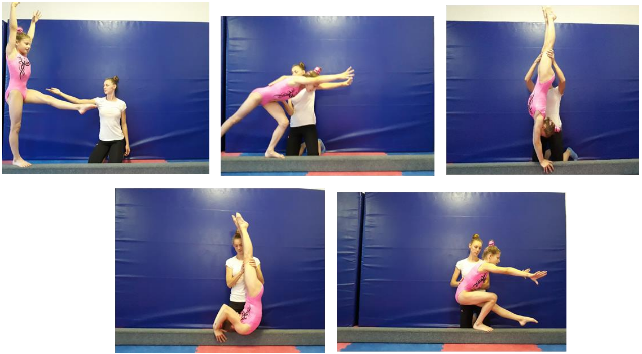
Slika 19. Asistencija stoj koluta