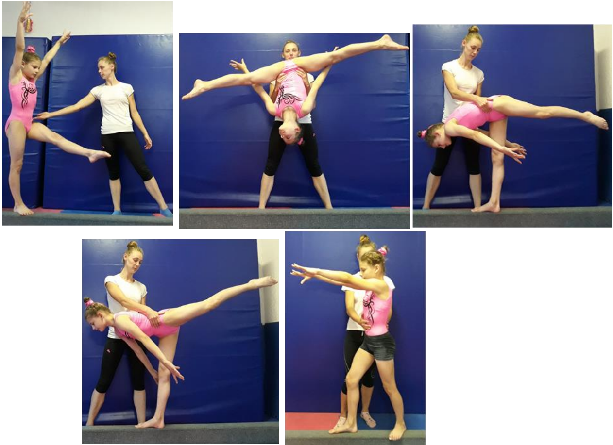
Slika 25. Asistencija „arabera“