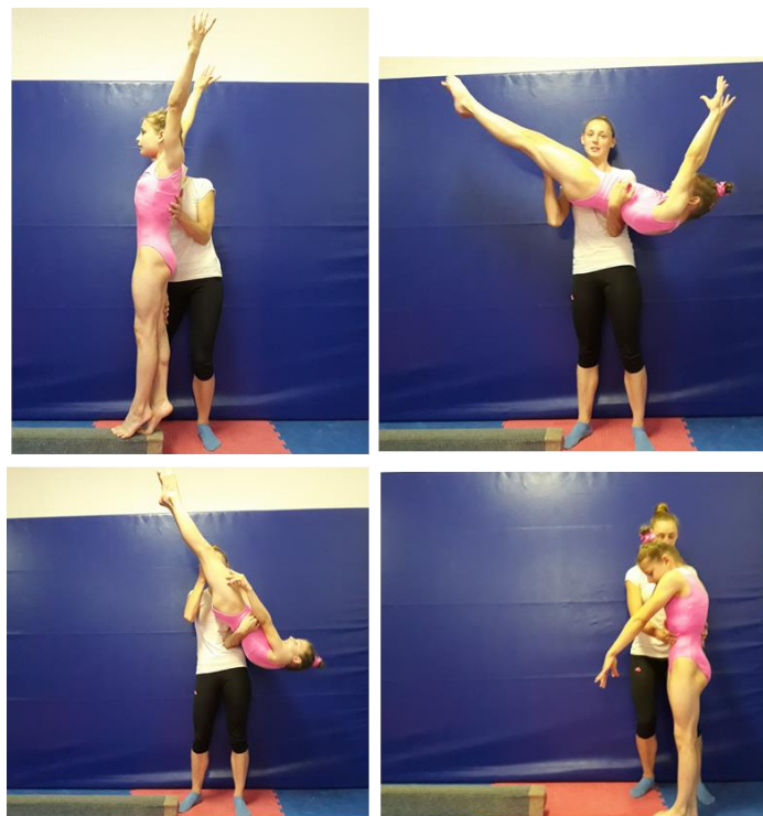
Slika 27. Asistencija salta natrag pruženog

Trener se nalazi čono u odnosu na gredu i bočno u odnosu na vježbačicu stojeći na mjestu doskoka iz rondata te pomaže kod izvedbe salta natrag. Nakon što vježbačica doskoči rondat trener postavlja ruke na donji dio leđa i drugu na stražnju stranu nogu. Kod doskoka ruku sa stražnje nogu prebacuje na trbuh kako bi osigurao siguran doskok.