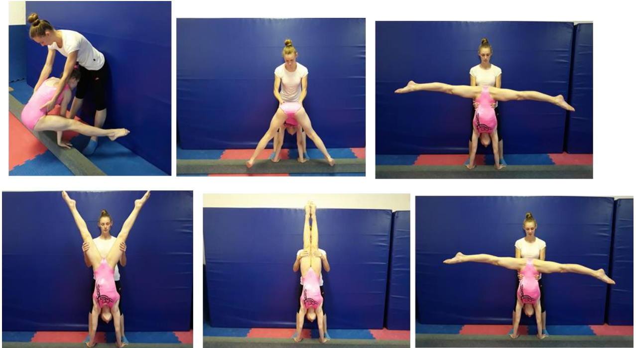
Slika 18. Asistencija „špičaka“

Trener stoji čeonu u odnosu na gredu i licem prema vježbačici te nakon što je napravila upor prednosom hvata vježbačicu za kukove i pomaže pri podizanju donjeg dijela tijela u stoj na rukama. Nakon što je stoj naglašen i zadržan minimalno dvije sekunde na isti način joj pomaže da se vrati u početni položaj.