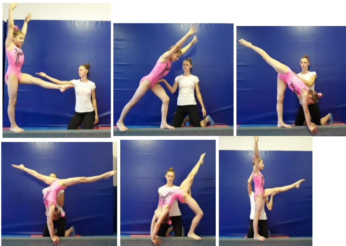
Slika 8. Asistencija mosta naprijed