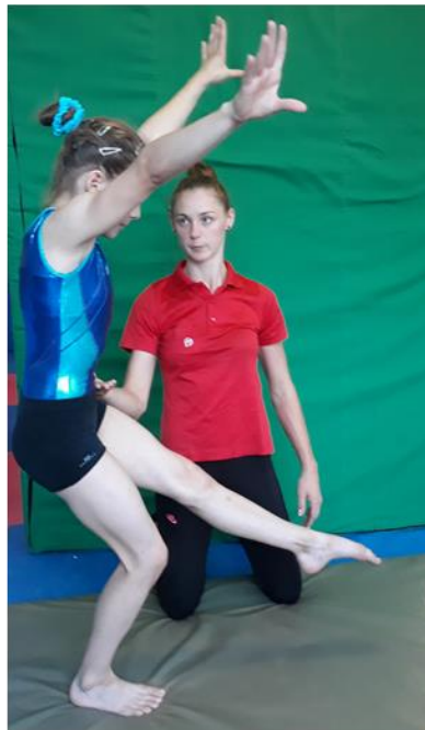
Slika 17. Asistencija salta naprijed u korak

Trener kod izvedbe ove akrobatske veze se nalazi bočno u odnosu na vježbačicu u stojećem položaju na mjestu doskoka iz salta naprijed te na taj način pomaže pri postizanju brzine za izvedbu ostatka akrobatske veze. Važno je da gimnastičarka nauči pravovremeno doskočiti iz salta naprijed i brzinu usmjeriti prema naprijed kako bi pravilno izvela rondat. Trener dalju ruku stavlja vježbačici na donji dio leđa, a bližu pod trbuh te je tako usmjerava naprijed i pomaže joj u postizanju brzine. Na ovakav način može asistirati tek kada je gimnastičarka u cijelosti usvojila element. Do tada trener uči vježbačicu samo doskok iz salta naprijed i ulazak u rondat kako bi usvojila taj prijelaz iz elementa u sljedeći element.