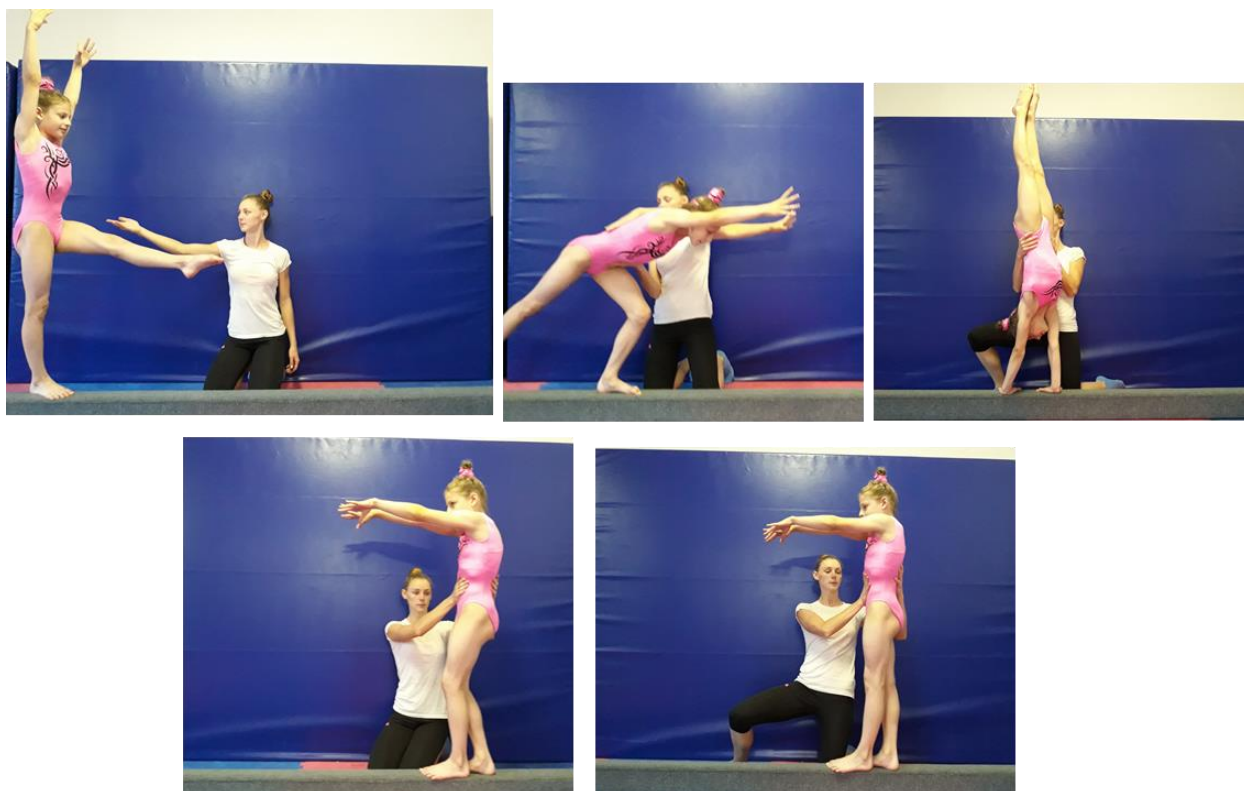
Slika 22. Asistencija roudata