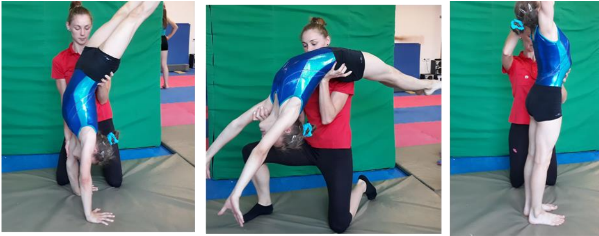
Slika 2. Asistencija premeta naprijed

Trener stoji na mjestu gdje vježbačica postavlja ruke bočno u odnosu na nju u klečećem položaju, te bližu ruku postavlja na njezino rame, a drugu ruku pod donji dio leđa. Ruka koja je na ramenu pomaže pri podizanju trupa u fazi odriva rukama i doskoka. Bitno je napomenuti vježbačici da tijekom cijelog premeta naprijed mora gledati u ruke te ne spuštati bradu na prsa jer na taj način usvaja najčešću grešku i završava premet naprijed u dubokom čučnju.