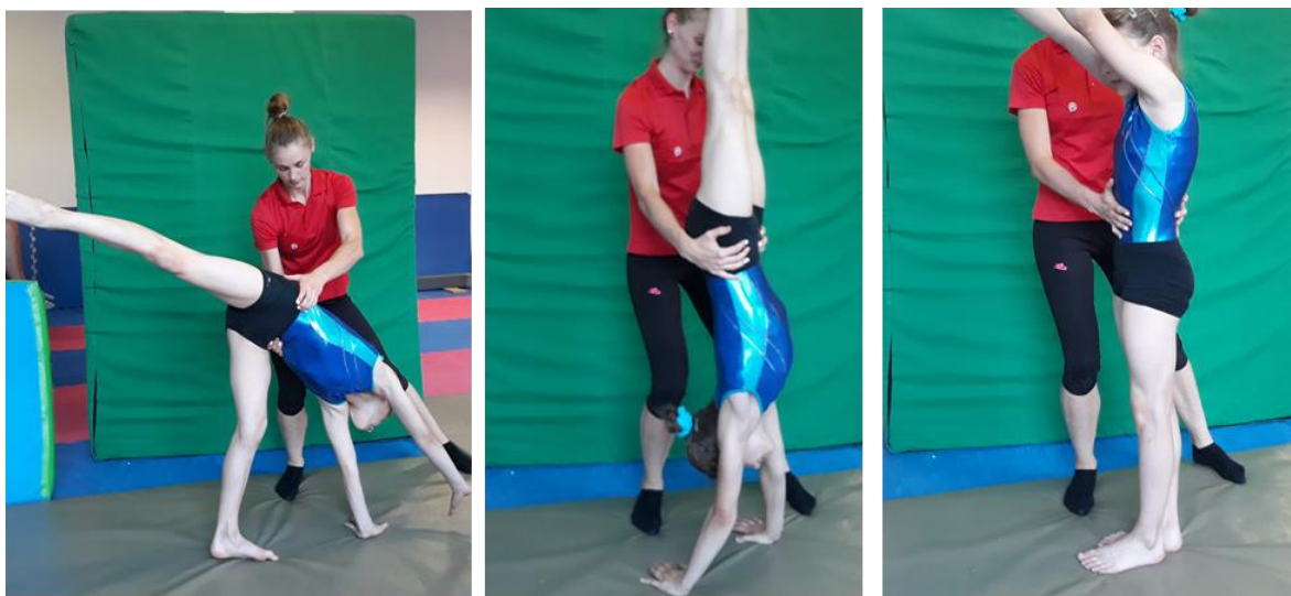
Slika 1. Asistencija rondata

Trener se nalazi sa strane odrazne noge u stojećem položaju, (Slika 1) te hvatom za bliži kuk jednom rukom i drugom za drugi kuk pomaže gimnastičarki da na taj način zadrži položaj gimnastičke grbice. U fazi doskoka ruku s kuka premješta na trbuh kako bi joj pomogao što čvršće doskočiti.