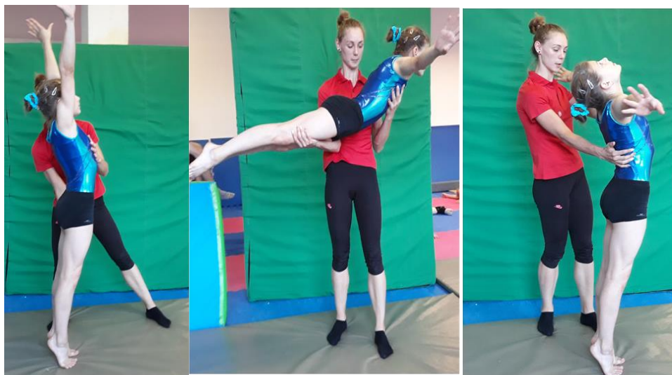
Slika 12. Asistencija pruženog salta naprijed