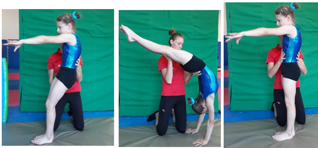
Slika 4. Asistencija rondat premeta natrag

Ova akrobatska veza se uči tek nakon što je svaki element dobro savladan zasebno. Trener se nalazi na mjestu doskoka iz rondata bočno u odnosu na vježbačicu u klečećem položaju. Mjesto doskoka iz rondata nije točno određeno te trener mora biti spreman procijeniti gdje će biti izveden doskok iz rondata i ovisno o tome se pravovremeno pripremiti za asistenciju premeta natrag. Nakon doskoka iz rondata trener postavlja jednu ruku (dalju) na donji dio leđa, a drugu (bližu) na stražnju stranu nogu te na taj način pomaže pri izvedbi premeta natrag.