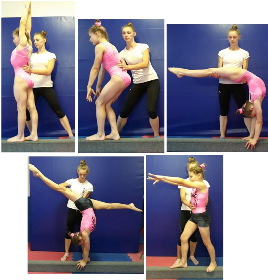
Slika 20. Asistencija menikelija