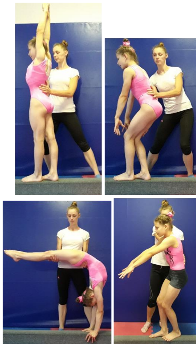
Slika 21. Asistencija premeta natrag