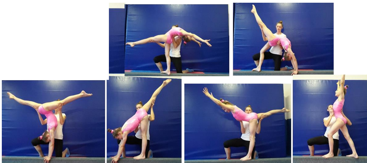
Slika 7. Asistencija mosta natrag