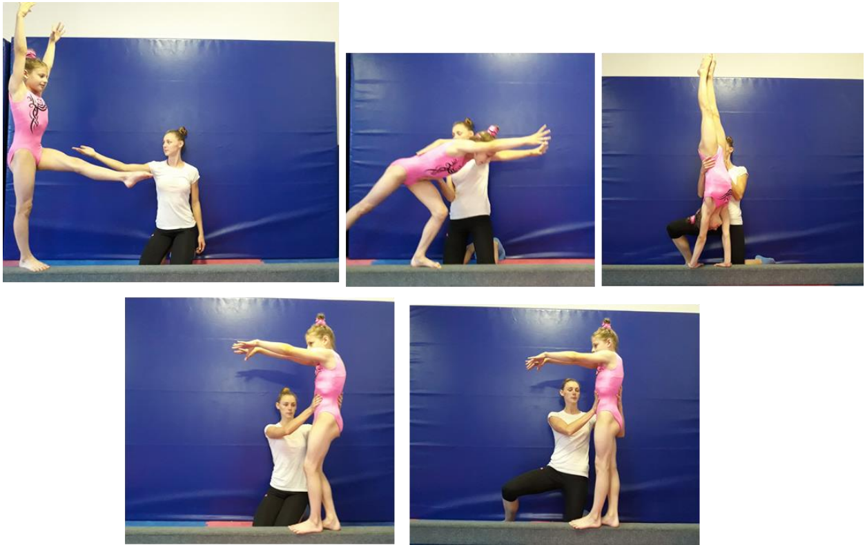
Slika 22. Asistencija roudata