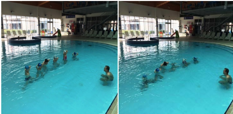
Slika 3. i 4. Disanje u mjestu. Lijeva slika (3): početna pozicija s rukama postavljenim iza glave. Desna slika (4): izvedba disanja u mjestu.