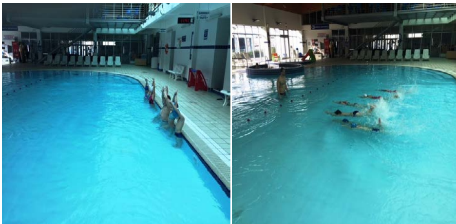
Slika 9. i 10. Klizanje u vodi. Lijeva slika (9): početna pozicija uz rub bazena. Desna slika (10): izvedba klizanja u vodi.

odličan (5)- samostalno izvodi klizanje 7 i više metara.