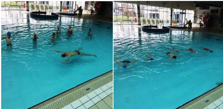
Slika 7 i 8. Plutanje na prsima. Lijeva slika (7): trener demonstrira plutanje na prsima. Desna slika (8): djeca izvode plutanje na prsima.

odličan (5)- položaj plutanja na prsima izvodi 7 i više sekundi.