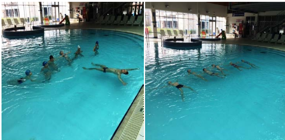
Slika 5 i 6. Plutanje na leđima. Lijeva slika (5): trener demonstrira plutanje na leđima. Desna slika (5): djeca izvode plutanje na leđima.

odličan (5)- samostalno zauzima položaj plutanja na leđima 10 i više sekundi.