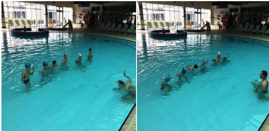
Slika 1 i 2. Uranjanje u mjestu. Lijeva slika (1): početna pozicija s pogrčenim rukama u laktu. Desna slika (2): izvedba uranjanja u mjestu.

odličan (5)- uranja i zadržava glavu pod vodom 4 i više sekundi.