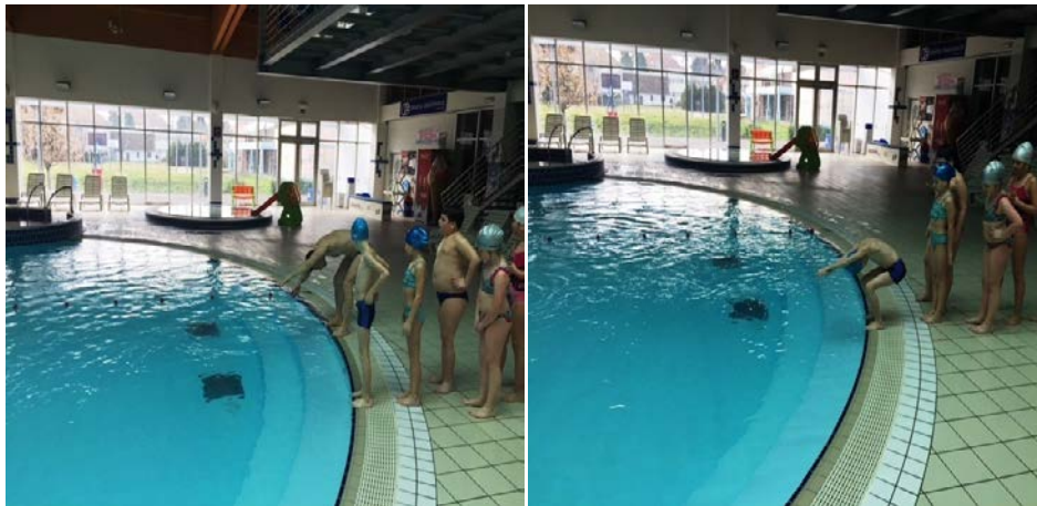
Slika 11 i 12. Skok u vodu. Lijeva slika (11): trener demonstrira početnu poziciju za skok na glavu. Desna slika (12): dijete zauzima početnu poziciju za skok na glavu.

odličan (5)- samostalno izvodi skok na glavu sunožnim odrazom, zamahom ruku u opružen položaj i ulazi u vodu u opruženom položaju.