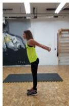
Slika 58. Vježba istezanja m. pectoralis major i m. biceps brachi