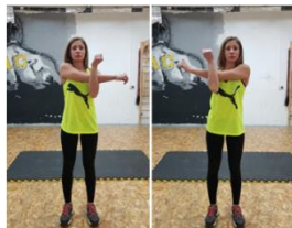
Slika 36. Vježba istezanja- m. deltoideus