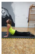
Slika 64. Vježba istezanja - mišići prednjeg dijela "cora"