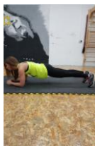
Slika 45. „Plank“- izdržaj i upor prednji na laktovima- vježba statičke snage