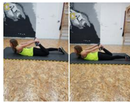
Slika 41. Vježba istezanja - m. kvadriceps