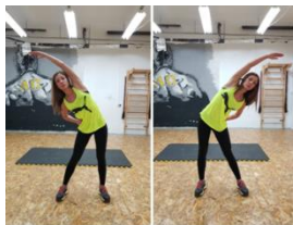
Slika 38. Vježba istezanja- m. latissimus dorsi