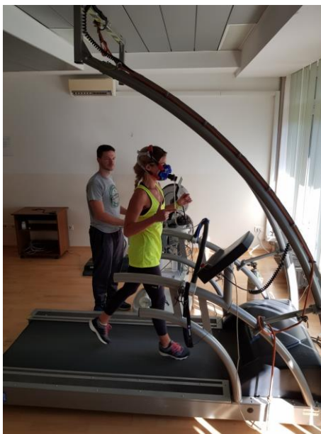
Slika 19. Progressivni test opterećenja na pokretnom sagu KF1