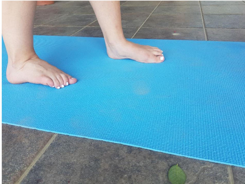
Slika 11. Hodanje na medijalnom svodu stopala

4.5. VJEŽBA 5. Hodanje na medijalnom svodu stopala (slika 11) potrebno je provoditi u 3 serije po 20 metara, ili dva puta u trajanju od 40 sekundi. Ukoliko to nije moguće, onda je potrebno u početku planirati više ponavljanja po 20 sekundi. Prilikom izvođenja potrebno je koljena što je moguće približiti, saviti prste, te hodati na unutarnjem, odnosno medijalnom svodu stopala.