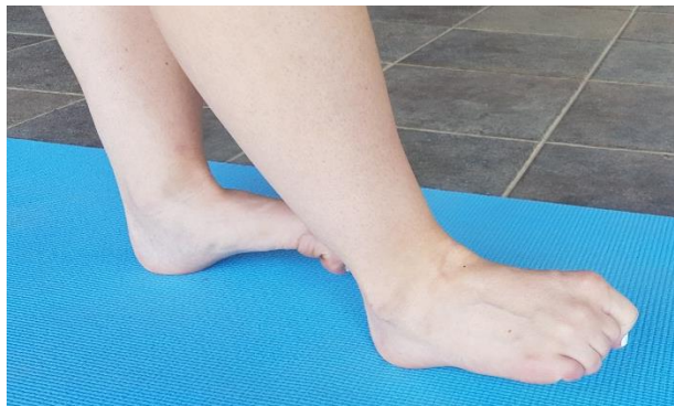
Slika 8. Hodanje na peti sa savinutim prstima

4.2. VJEŽBA 2. Hodanje na peti sa savinutim prstima (slika 8) potrebno je provoditi u 5 dužina po 20 metara ili dva puta u trajanju od 60 sekundi. Ukoliko to nije moguće, onda jje potrebno u početku planirati više ponavljanja po 30 sekundi. Prilikom izvođenja potrebno je aktivno podići i savinuti prste te hodati na stražnjoj trećini stopala, tj. peti.