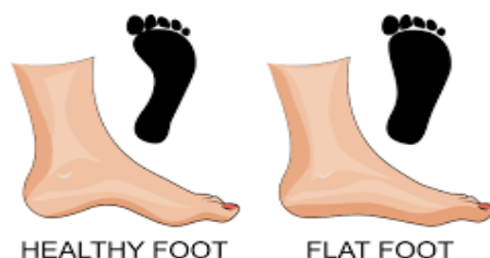
Slika 3. Plantogram normalnog i spuštenog stopala

Plantografija je jednostavna metoda kojom utvrđujemo spuštenost stopala na način da osoba umoći stopalo u obojanu tekućinu, npr. tintu, te stane na bijeli papir punim stopalom. Tako dobivamo otisak ili plantogram. Nadalje, spuštenost stopala određujemo pomoću Clark-ove metode na način da prvo utvrđujemo najizbočeniju točku u gornjem dijelu stopala (točka A), zatim u donjem dijelu stopala (točka B) i spojimo te dvije točke. Najgornji dio koji prelazi u kruškoliki dio stopala odredimo kao točku C te na kraju spojimo točke A i C i dobijemo kut koji bi trebao biti 45^\circ . Ukoliko je taj kut manji, imamo spušteno stopalo (Ciliga, Trošt Bobić, 2013).