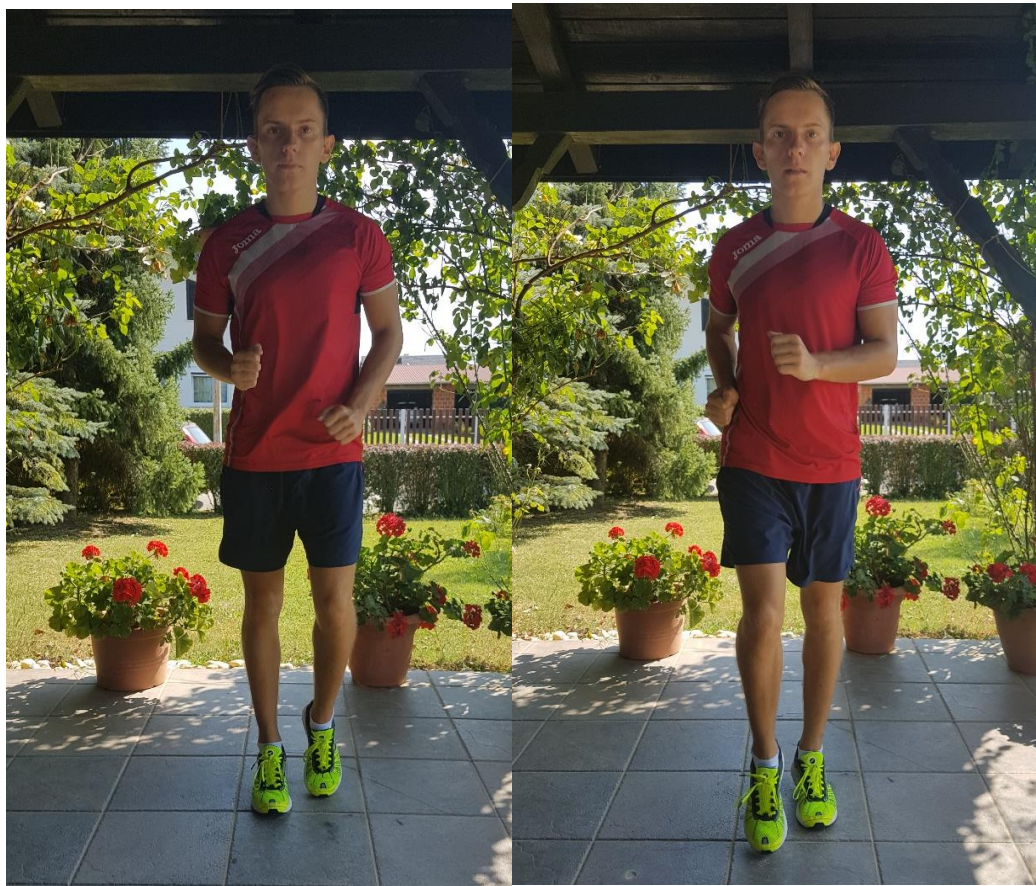
Slika 23. Niski skip

6.1. VJEŽBA 1. Niski skip ( slika 23) potrebno je provoditi u 3 dužine po 20 metara ili 3 puta u trajanju od 30 sekundi. Vježba se izvodi na način da pokret noge inicira se iz kuka i započinje dizanjem, odnosno guranjem koljena naprijed, čime se automatski podiže stopalo vodeće noge na prste. Prebacivanje oslonca na vodeću nogu popraćeno je aktivnim pružanjem u koljenu i stiskanjem pete u podlogu. Rad ruku prati rad nogu.