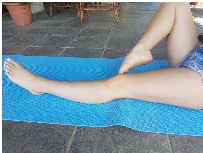
Slika 19. Dodirivanje koljena suprotne noge

4.13. VJEŽBA 13. Dodirivanje koljena suprotne noge (slika 19) potrebno je provoditi 12 ponavljanja u dvije serije za svaku nogu. Vježba se izvodi u sjedećem položaju. Jedna noga je ispružena, dok ona koja je pogrčena dodiruje koljeno ispružene noge.