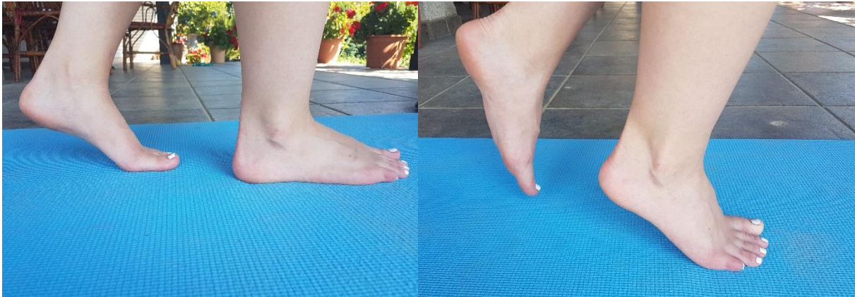
Slika 16. Hodanje s podizanjem na prste

4.10. VJEŽBA 10. Hodanje s podizanjem na prste (slika 16) potrebno je provoditi 15 ponavljanja u dvije serije. Vježba se izvodi u hodu na način da se osoba na svaki učinjeni korak podiže na prste.