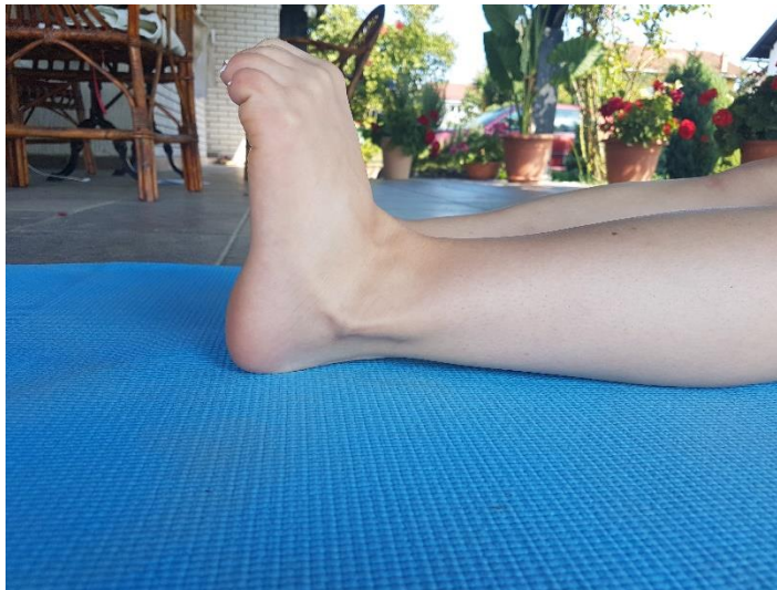
Slika 21. Fleksija prstiju stopala iz sjedećeg stava sa zategnutim stopalima prema licu

4.15. VJEŽBA 15. Fleksiju prstiju stopala iz sjedećeg stava sa zategnutim stopalima prema licu (slika 21) potrebno je provoditi dva puta u trajanju od 10 sekundi. Vježba se izvodi u sjedećem stavu sa ispruženim nogama na način da se stopala zategnu prema licu, prsti flektiraju, te se izvodi izdržaj.