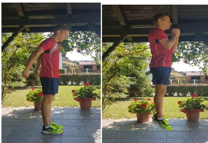
Slika 27. Sunožni skokovi

6.5. VJEŽBA 5. Sunožne skokove (slika 27) potrebno je provoditi kroz 8 ponavljanja u dvije serije. Skokovi se izvode s tendencijom u vis. Tijelo je čvrsto i ispruženo (bez grčenja koljena). Zamah rukama izvodi se od nazad prema naprijed. Doskok sunožan uz amortizaciju.