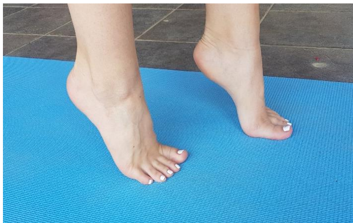
Slika 7. Hodanje na prstima

4.1. VJEŽBA 1. Hodanje na prstima (slika 7) potrebno je provoditi u 5 dužina po 20 metara ili dva puta u trajanju od 60 sekundi. Ukoliko to nije moguće, onda je potrebno u početku planirati više ponavljanja po 30 sekundi. Prilikom izvođenja treba pripaziti da pete budu aktivno podignute te da radi umora ne „padaju“ lateralno i dolje.