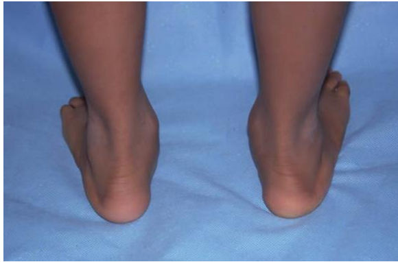
Slika 1. Inspekcija stopala

Pregled spuštenosti stopala uvijek prvo započinje inspekcijom, a nastavlja palpacijom. Da bi se dobio pravi uvid u stanje stopala, sve strukture, odnosno mišići, ligamenti i zglobovi moraju biti relaksirani. Inspekcija stopala uključuje samo pregled stopala bez dodirivanja. Moguće ju je provesti samostalno kod kuće.