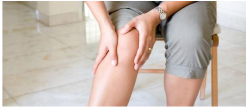
Slika 6. Bol u koljenu-posljedica spuštenog stopala

puta tjedno. Osobama koje nisu tjelesno aktivne neće biti dovoljno raditi samo te vježbe, nego ih se treba „osvijestiti“ i pokazati značaj svakodnevnog tjelesnog vježbanja, te ih uključiti u neku od sportskih rekreativnih aktivnosti. Takve osobe nerijetko imaju napravilnu prehranu, lošu posturu, prekomjernu tjelesnu težinu, lošu kvalitetu života, te razne druge deformacije, tako da im samo te vježbe ne bi značajno pomogle.