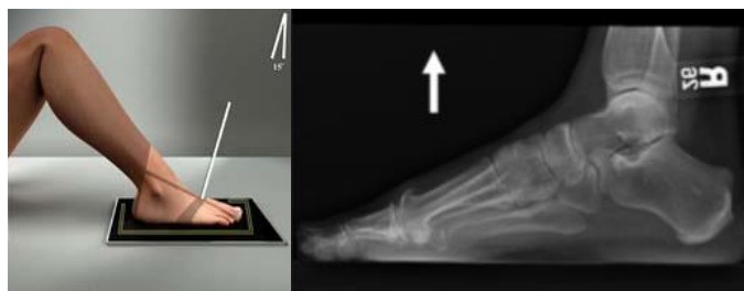
Slika 4. Rendgenografija stopala

Rendgenografija stopala je snimanje stopala rendgenskim zračenjem u radiološkom uređaju. Slika koja se dobije naziva se rendgenogram, na temelju koje se registriraju detalji koji se ne mogu uočiti prostim okom.