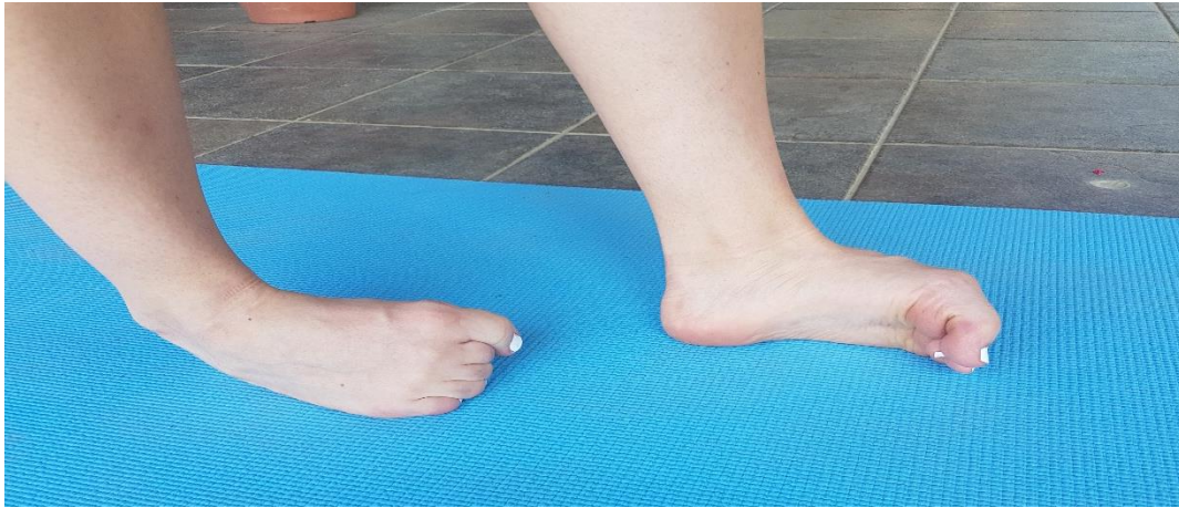
Slika 10. Hodanje na lateralnom svodu stopala

4.4. VJEŽBA 4. Hodanje na lateralnom svodu stopala (slika 10) potrebno je provoditi u 3 serije po 20 metara, ili dva puta u trajanju od 40 sekundi. Ukoliko to nije moguće, onda je potrebno u početku planirati više ponavljanja po 20 sekundi. Prilikom izvođenja prste treba saviti, te hodati na vanjskom, odnosno lateralnom svodu stopala.