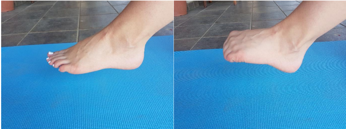
Slika 13. Skupljanje prstiju

4.7. VJEŽBA 7. Skupljanje prstiju (slika 13) potrebno je provoditi 15 ponavljanja u dvije serije. Vježba se izvodi u mjestu sa stopalom podignutim od tla. Izvodi se fleksija i ekstenzija prstiju, uz to da se položaj prstiju u fleksiji zadrži 2 do 3 sekunde.