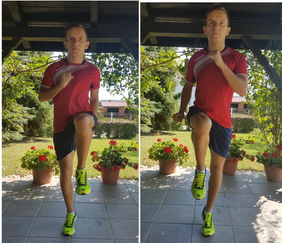
Slika 24. Visoki skip

6.2. VJEŽBA 2. Visoki skip (slika 24) potrebno je provoditi u 3 dužine po 15 metara ili 3 puta u trajanju od 20 sekundi. Vježba se izvodi na način da pokret kreće visokim dizanjem koljena, dok stopalo zamašne noge slijedi dijagonalu kroz koljeno oslonačne noge do završne pozicije. U završnoj poziciji potkoljenica je opuštena i s natkoljenicom zatvara kut od 90°. Tijekom zamašne faze stopalo je zategnuto, a prije kontakta s podlogom aktivno se spušta i ostvaruje kontakt ispod centra težišta tijela. Izmjena nogu odvija se bez međuposkoka, a težište tijela se nalazi između nogu. Rad ruku prati rad nogu.