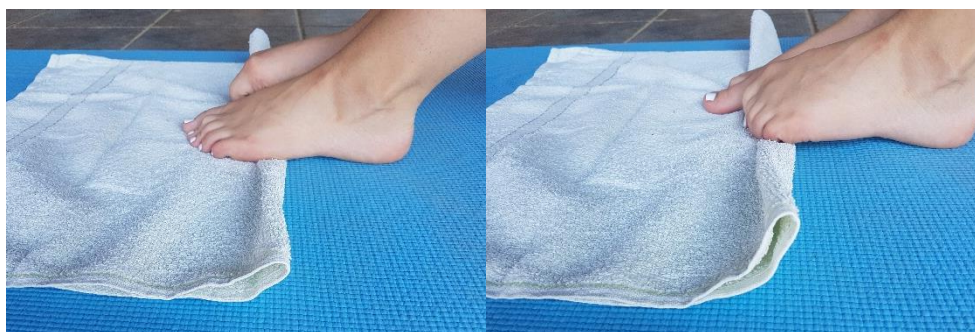
Slika 17. Namotavanje ručnika

4.11. VJEŽBA 11. Namotavanje ručnika (slika 17) potrebno je provoditi dva puta u trajanju od 20 sekundi. Osoba se nalazi u sjedećem položaju sa fleksijom u koljenima. Namotavanje ručnika izvodi se samo prednjom trećinom stopala.