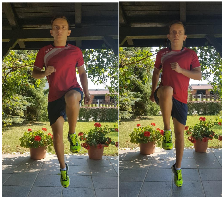
Slika 25. „Indijanci“

6.3. VJEŽBA 3. „Indijance“ (slika 25.) je potrebno provoditi kroz 10 ponavljanja u dvije serije. Tijelo je ravno i čvrsto. Pogled je usmjeren prema naprijed. Izvodi se odraz u vis na način da je jedna noga ispružena, dok je druga pogrčena. Izvodi se zamah rukom do brade (suprotna ruka, suprotna noga).