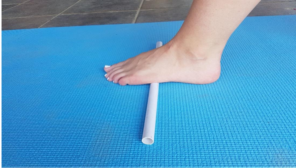
Slika 14. Valjanje stopala

4.8. VJEŽBA 8. Valjanje stopala (slika 14) potrebno je provoditi dva puta u trajanju od 60 sekundi za svaku nogu. Sredinom stopala stanemo na valjak i valjamo naizmjenično naprijed-nazad. Težina tijela nalazi se na suprotnoj nozi od one koju „valjamo“.