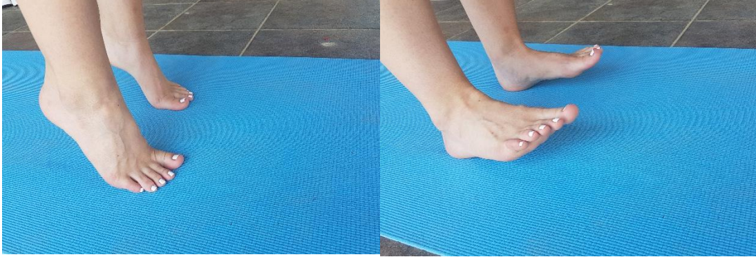
Slika 9. Zibanje prsti-peta u mjestu

4.3. VJEŽBA 3. Zibanje prsti-peta u mjestu (slika 9) potrebno je provoditi 12 ponavljanja u dvije serije. Vježba se izvodi u mjestu. Prilikom podizanja i na prste i na petu, potrebno je zadržati taj položaj sekundu do dvije.