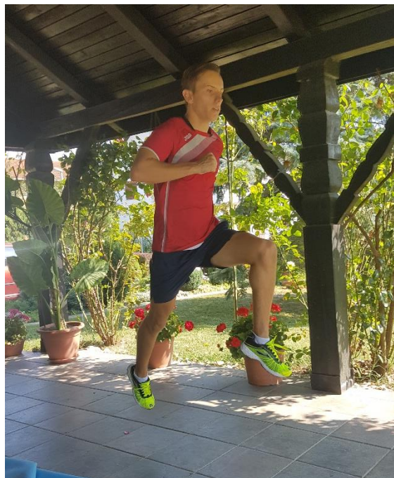
Slika 29. Skokovi s noge na nogu

6.7. VJEŽBA 7. Skokove s noge na nogu (slika 29) potrebno je provoditi kroz 10 ponavljanja u dvije serije. Radi se odraz s jedne noge, dok je druga pod 90°. Skokovi se izvode s tendencijom u dalj.