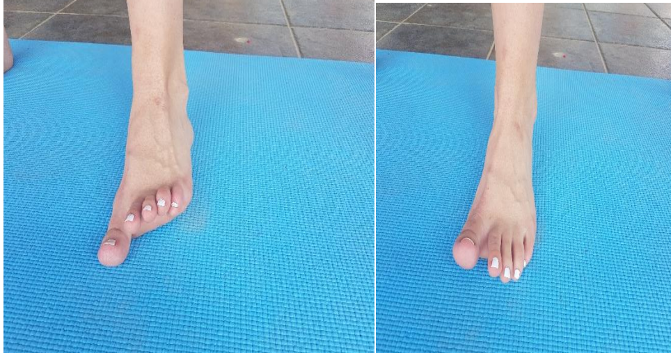
Slika 12. Ples prstima

4.6. VJEŽBA 6. Ples prstima (slika 12) potrebno je provoditi 12 ponavljanja u dvije serije. Vježba se izvodi u mjestu. Naizmjenično podizanje palca, te ostalih prstiju. Svaki položaj zadržati sekundu do dvije.