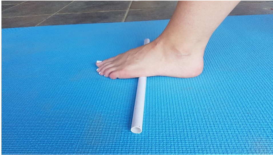
Slika 14. Valjanje stopala

4.8. VJEŽBA 8. Valjanje stopala (slika 14) potrebno je provoditi dva puta u trajanju od 60 sekundi za svaku nogu. Sredinom stopala stanemo na valjak i valjamo naizmjenično naprijed-nazad. Težina tijela nalazi se na suprotnoj nozi od one koju „valjamo“.