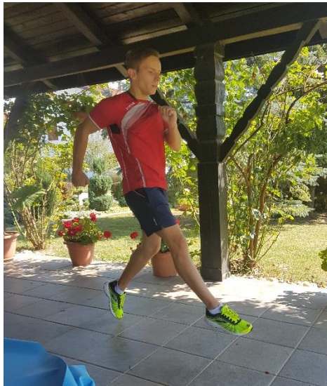
Slika 26. Izbacivanje potkoljenica

6.4. VJEŽBA 4. Izbacivanje potkoljenica (slika 26) potrebno je provoditi kroz 8 ponavljanja u dvije serije. Tijelo je u blagom pretklonu, noge su pružene u koljenu uz zadržavanje blage fleksije. Pokret se inicira iz kuka dizanjem nogu, a ne udarcem. Podloga se grabi cijelom nogom i stopalom koje je prilikom dizanja noge zategnuto prema potkoljenici te aktivno grabi tlo pružanjem prilikom kontakta. Rad ruku prati rad nogu.