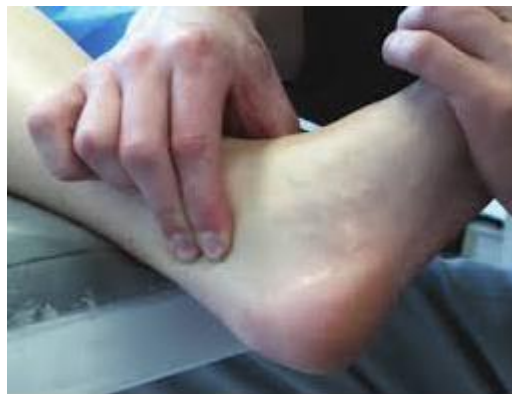
Slika 2. Palpacija stopala

Palpacijom se određuje prisutnost i lokalizacija bolne osjetljivosti putem dodira. Kao i kod inspekcije, mišići, ligamenti i zglobovi trebaju biti relaksirani. Vrlo često kod odraslih osoba javlja se bol u prednjem dijelu stopala, koja postupno sve više jača. Dolazi i do otekline stopala i gležnjeva zato što oslabljena muskulatura djeluje na usporenu vensku cirkulaciju.