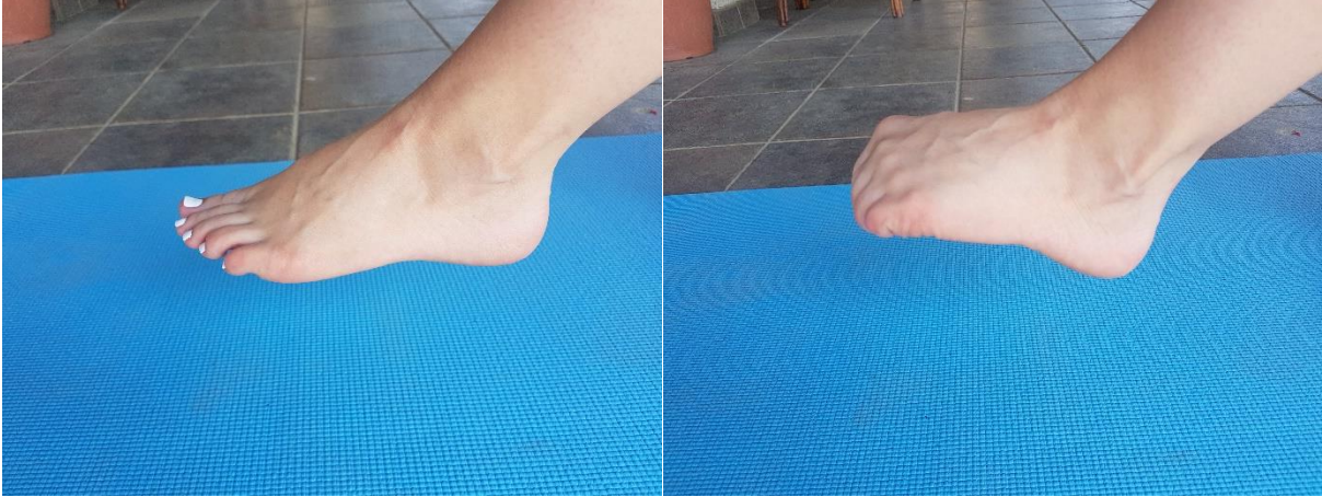
Slika 13. Skupljanje prstiju

4.7. VJEŽBA 7. Skupljanje prstiju (slika 13) potrebno je provoditi 15 ponavljanja u dvije serije. Vježba se izvodi u mjestu sa stopalom podignutim od tla. Izvodi se fleksija i ekstenzija prstiju, uz to da se položaj prstiju u fleksiji zadrži 2 do 3 sekunde.