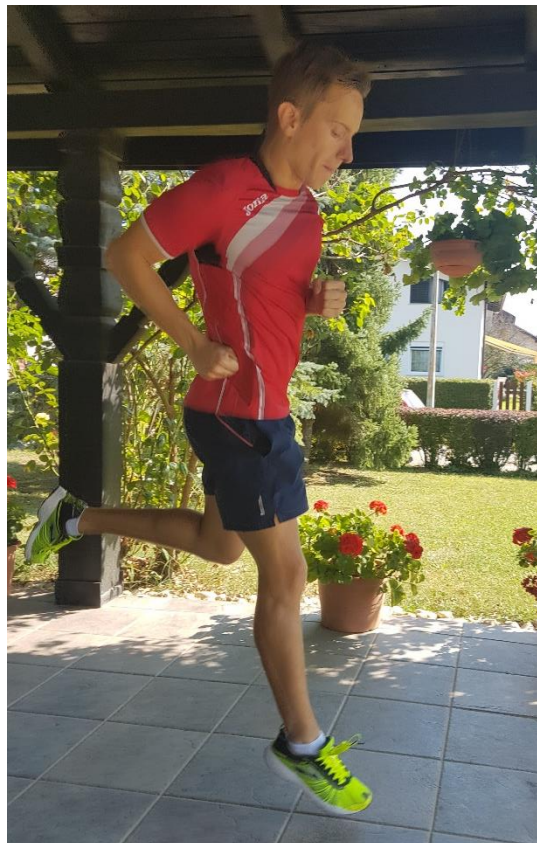
Slika 28. Skokovi na jednoj nozi

6.6. VJEŽBA 6. Skokove na jednoj nozi (slika 28) potrebno je provoditi kroz 6 ponavljanja u dvije serije. Izvodi se na način da se radi odraz s jedne noge, dok je druga pogrčena u koljenu. Bitno je odraziti se što više, ali i što dalje. Skočnom nogom izvodi se kružni pokret prema naprijed.