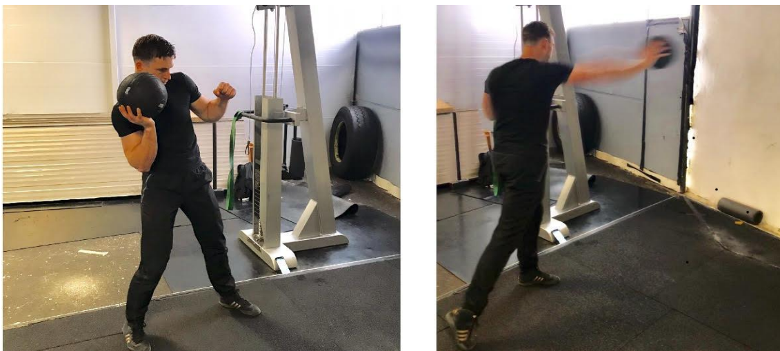
Slika 2. Izbačaj teške lopte u vidu desnog direkta, (vlastita fotografija).