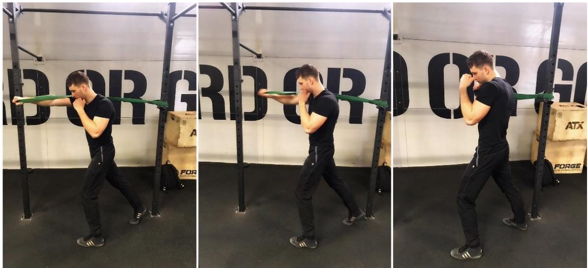
Slika 1. Desni direkt uz otpor elastične gume.