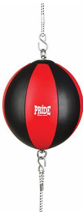
Slika 8. Brza lopta.

Možemo reći da je to mini boksačka vreća napunjena zrakom. Pomoću kruške možemo razvijati koordinaciju ruku, imamo različite kombinacije udaraca gdje specifično iz kružnog okreta u laktu udaramo sa šakom. Kombinacije udaraca na kruški: (udaramo samo jednom rukom, obadvjema, te razne kombinacije (10 x jedna, 10 x druga) + kratki direktni, bez kratkih direkata, s radom nogu u mjestu ili bez..).