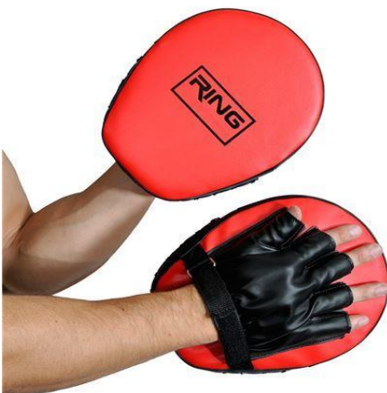
Slika 6. Fokuseri.