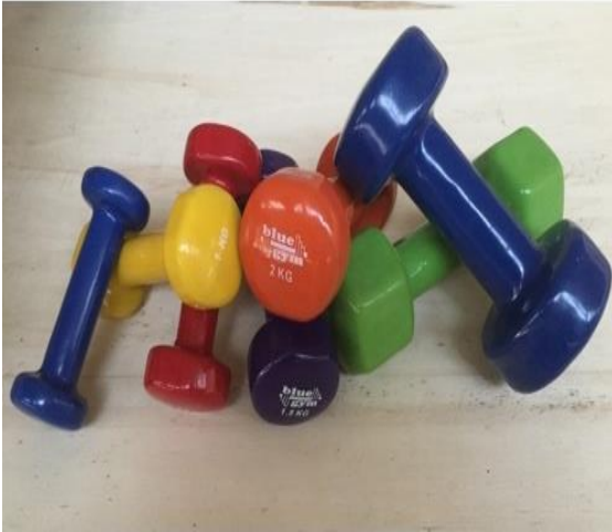
Slika 5. Bučice (1-5 kg).

Specifična izdržljivost koja se manifestira kroz boksačke udarce i različite kombinacije udaraca. Poslije fokusera najsličnija aktivnost boksačkom meču. Na boksačku vreću izvode se pojedinačni udarci, različite kombinacije udaraca i finiši. Mogu se izvoditi u mjestu i u kretanjama oko vreće, u svim režimima rada.