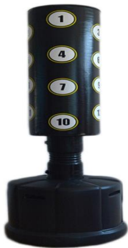
Slika 11. Samo stojeća boksačka vreća.