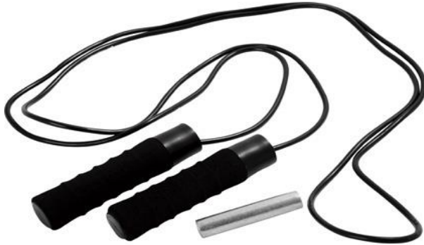
Slika 3. Vijača s utezima.