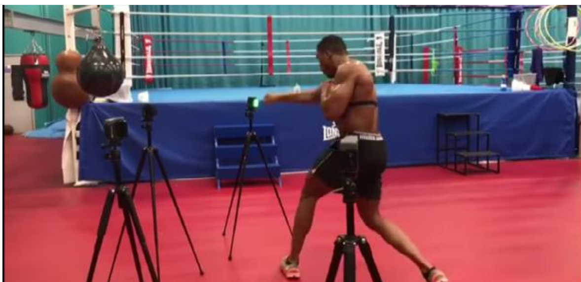
Slika 9. Šado boks,reakcija.