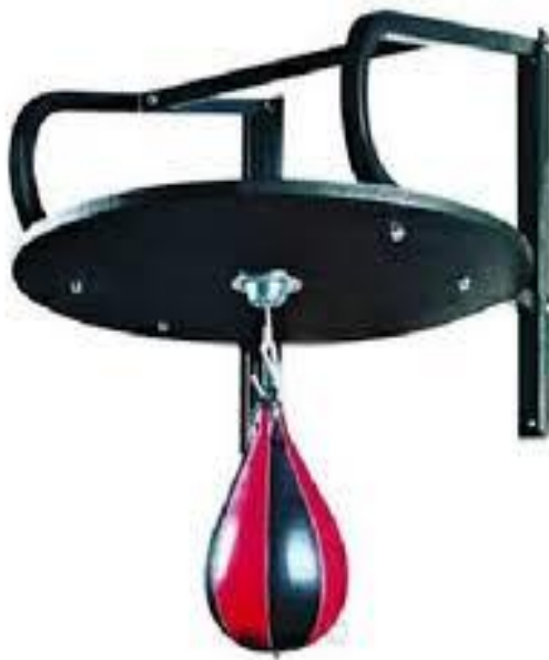
Slika 7. Kruška.