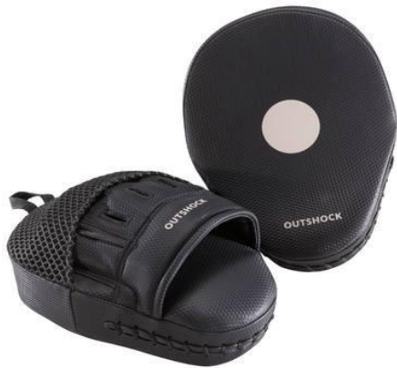
Slika 12. Fokuseri.