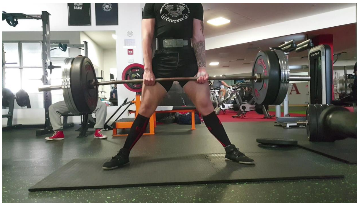
Slika 4. Prikaz mrtvog dizanja korištenjem magnezija (uvjet 2).