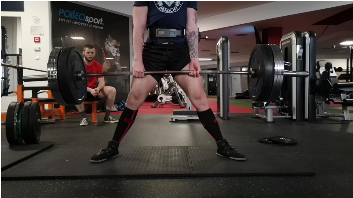
Slika 2. Prikaz mrtvog dizanja bez ergogenih pomagala, samo sa šipkom, (uvjet 1).