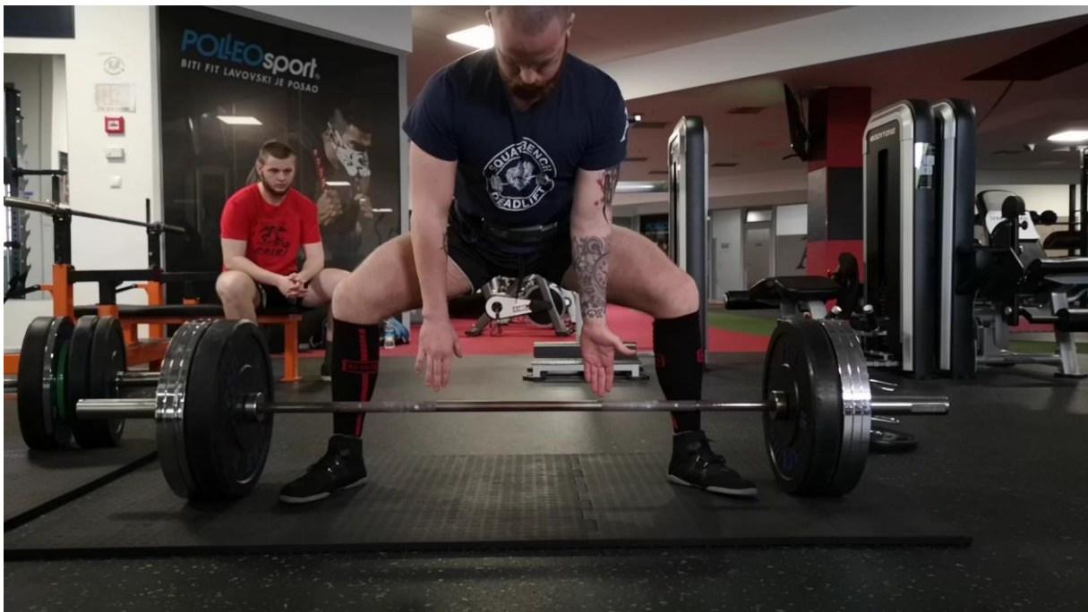
Slika 1. Prikaz pripreme za mrtvo dizanje bez ergogenih pomagala, samo sa šipkom, (uvjet 1).

Svako ponavljanje zabilježeno je s dvije kamere u frontalnoj i sagitalnoj ravnini s ciljem video analize u softveru Tracker - video analysis and modeling tool (The Open Source Physics). U navedenom softveru dobiveni su parametri vršne ( v_{\max} ) i prosječne brzine ( v_{\text{avg}} ) (kretanja šipke u frontalnoj ravnini) na temelju kojih su uz pomoć savladane težine ( F ) izračunati parametri vršne ( P_{\max} = F \cdot v_{\max} ) i prosječne snage ( P_{\text{avg}} = F \cdot v_{\text{avg}} ) (Slika 4).