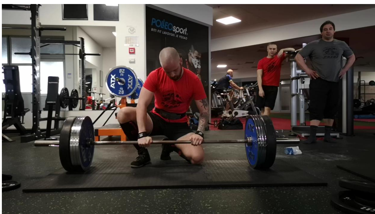
Slika 5. Prikaz pripreme za mrtvo dizanje korištenjem gurtne (uvjet 3).