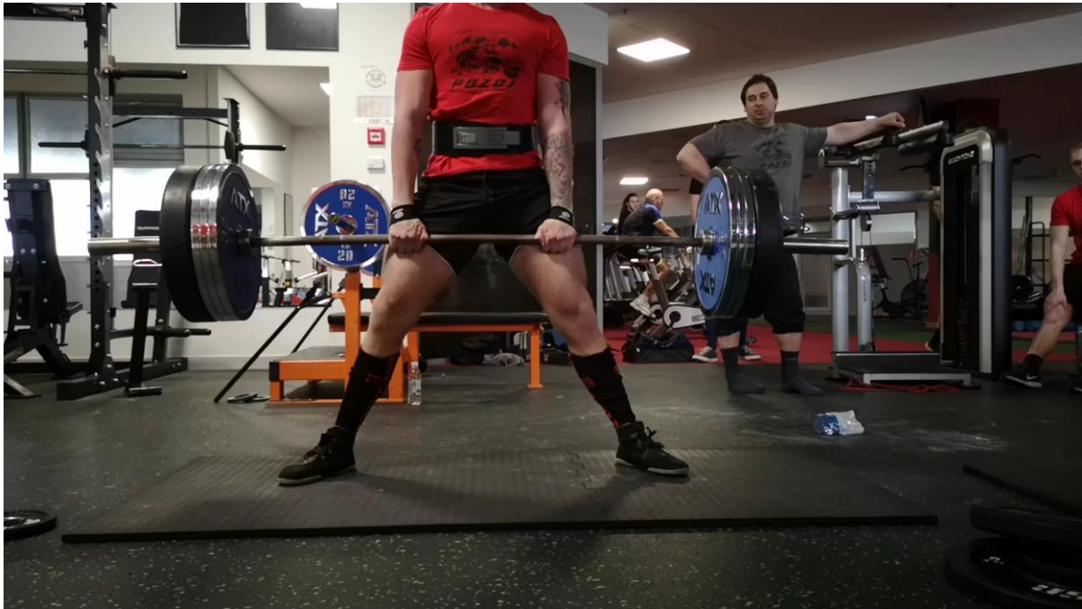
Slika 6. Prikaz mrtvog dizanja korištenjem gurni (uvjet 3).