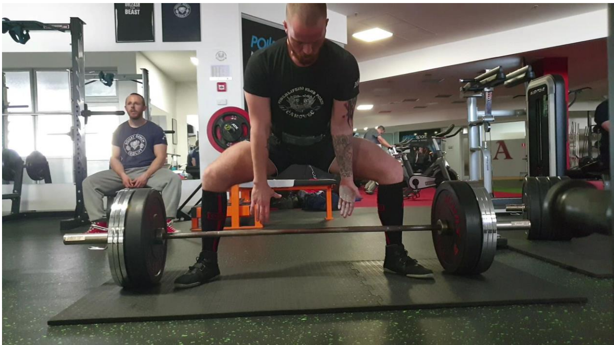
Slika 3. Prikaz pripreme za mrtvo dizanje korištenjem magnezija (uvjet 2).